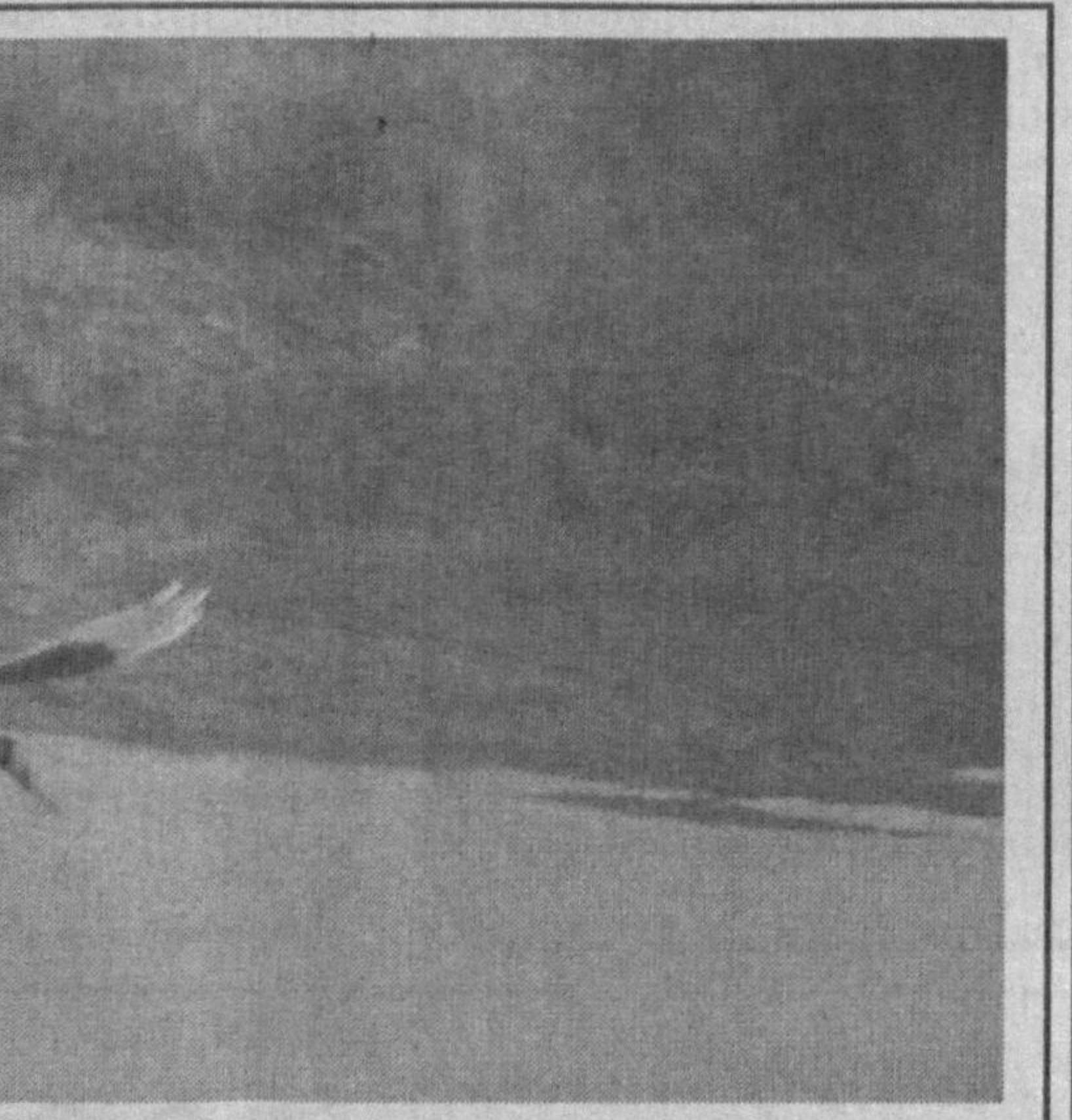
укам билан видолашишга чорлаганини хос этдим. Шу-шу қушга илхосим ошди. Орадан бир йил

таниш асалчи домладан: «Домла, анави куш хосиятлими, хосиятсизми?» деб сўрадим. Асалчи: «У куш хосиятли, иним, уни ҳаққўй дейишади...»