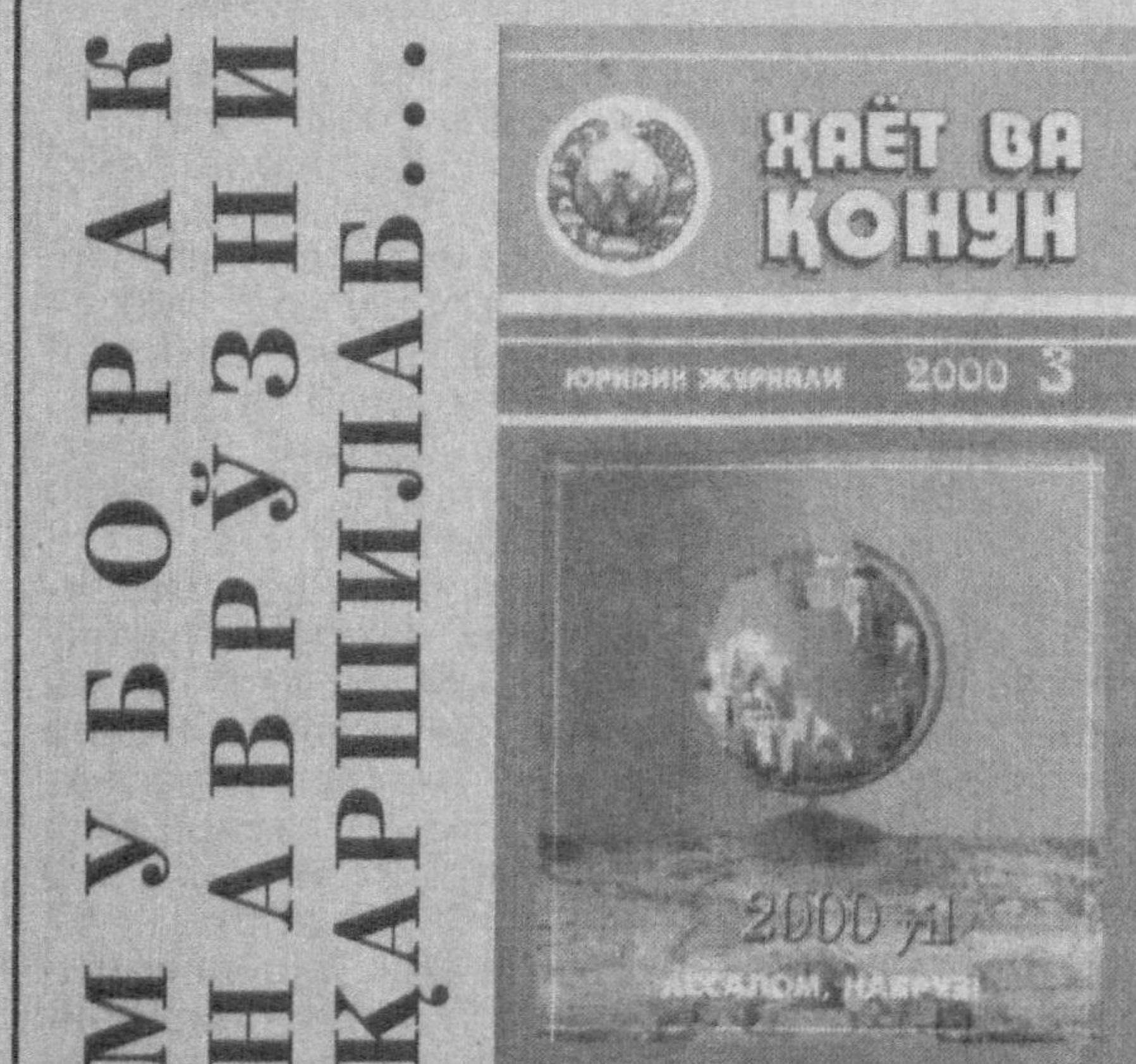
Журналимизнинг март сони нашрдан чиқди