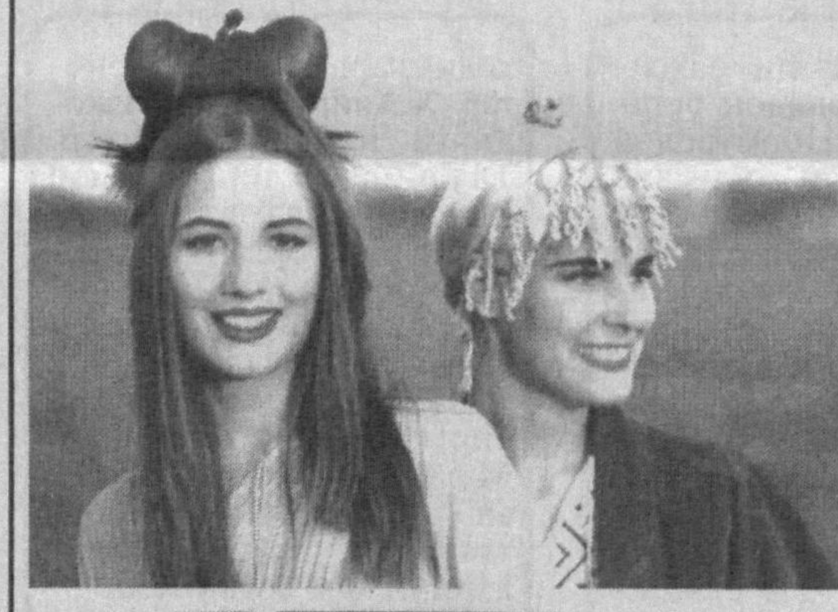
«Соч ҳам хусн» танловига юборилган ҳазил суратлар.

«Beatriz» балиқчилар кемасига қонли тажовуз қилди. Денгизчилар уни тўқнашувга қандайдир сониялар қолганда пайқашган. У қўққисдан осмондан тушгандек кема қаршисида пайдо бўлган.