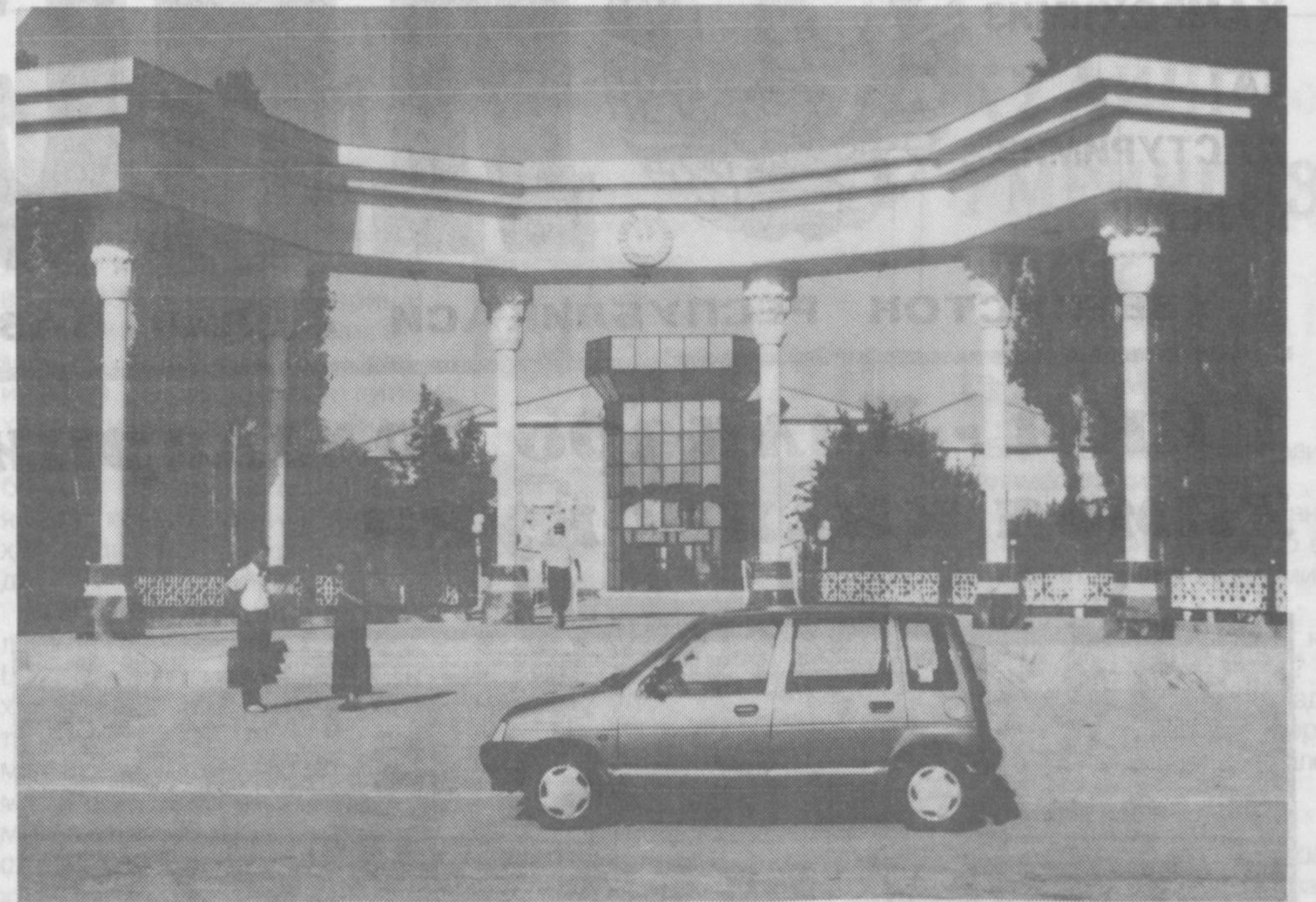
Жиззах: Истиқлол йилларидаги бунёдкорлик.

Вилоятда 8442 та ҳўжалик субъекти фаолият кўрсатмоқда. Шундан 3764 таси кичик ва ўрта тадбиркорлик субъекти бўлиб, уларда 38542 киши, умуман, ҳўжалик субъектларида 298367 киши меҳнат қилаяпти.