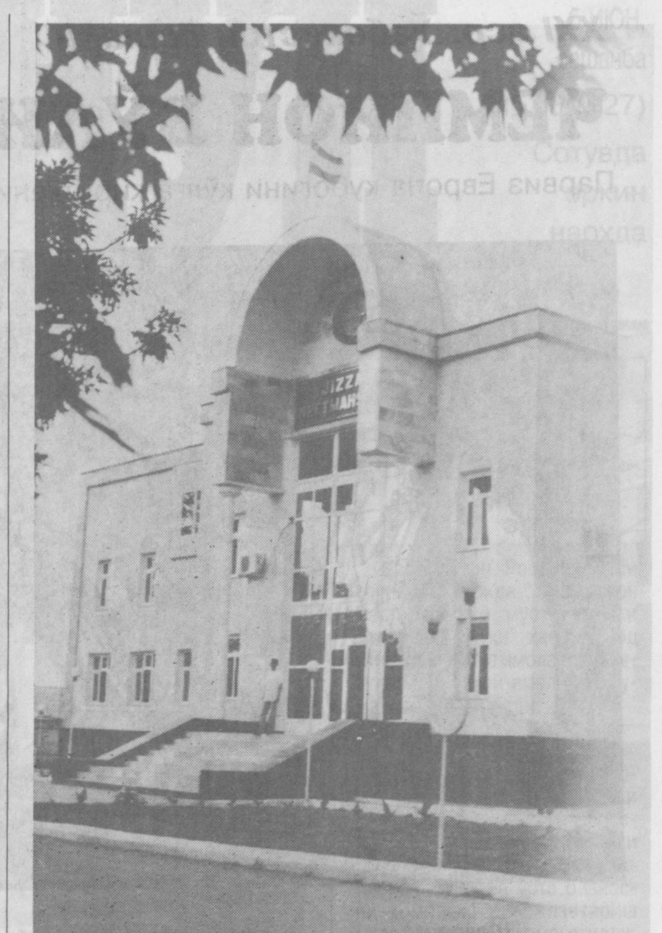
Жизза: Истиқлол йилларидаги бунёдкорлик.

Масалан, айтайлик, Амударё оқиб ўтадиган қўшни мустақил давлатлардан бирода сувдан кўп миқдорда ноўрин фойдаланилса ёки қандайдир тайинсиз мақсад йўлида исрофгарчиликка йўл қўйилса, бу ҳеч шубҳасиз, дарёнинг қўйи ҳудудига бошқа бир мустақил мамлакат аҳолиси ҳаётига ўзининг салбий таъсирини ўтказмай қолмайди. Чунки дарёнинг суви ҳам беҳисоб эмас, аксинча, ҳар бир қатра сувнинг ўз ўрни бор. Шундай экан, бу дарёларни асра-авайлаш ҳаётни, келажак наслларни ҳимоя қилишда, десак, асло хато бўлмайди.