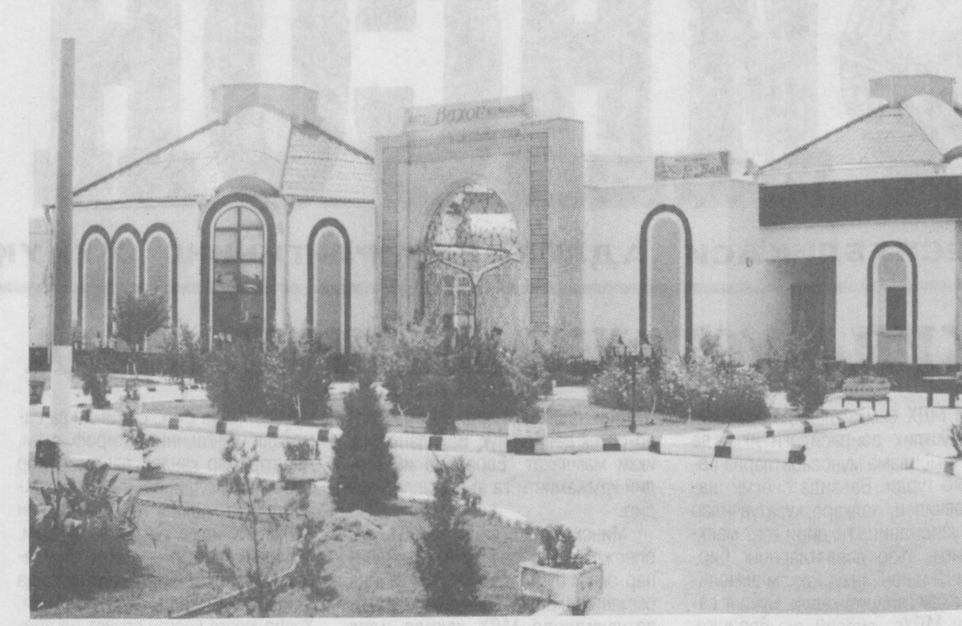
Сирдарё: мустақиллик йилларидаги бунёдкорлик

Мен, Жўраев Шомурод бундан ролпа роса 50 йил бурун Мудин қишлоғида туғилганман. Ота-онам ҳам шу далада ишлаб, тирикчилик қилган. «Волга» олиб, ҳайдовчилик хунарини эгаллаган бўлсам ҳам, асли шу даладан, пахтанинг одамидан. Ердан кўнгли узиб кетолмайман. Хотиним Гулнора ҳам шу далада воёга етган. Худо берган икки ўғил, уч қизимнинг доғиси ҳам шу дала. Уч йилдан бери ҳужжаликдан ижарага уч гектар ери олиб пахта экамиз. Ҳар йили режани ошириб бақарамиз. Еримиз ҳужжаликнинг чеккасида. Яна икки гектар қўшимча ери очиб, 5 гектарга етказдим. Шундан сўнг хотиним, болаларимни жамлаб, маслаҳат солдим. Далада ишлашса, чинакамга иш-