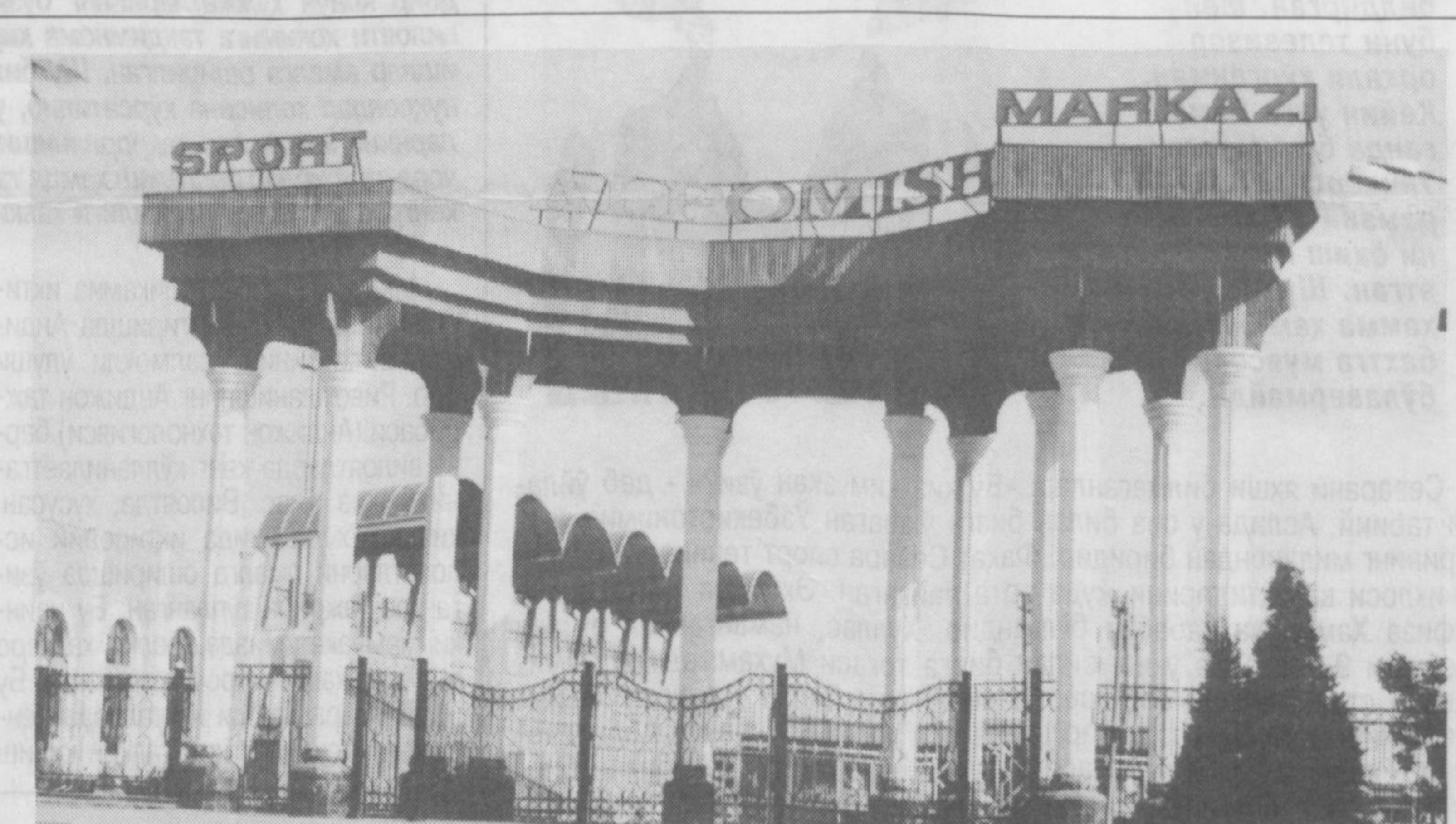
Сирдарё: мустақиллик йилларидаги бунёдкорлик

бир томоннинг бақаргани-ю, иккинчи томоннинг эса мутлақо бақармаганлиги акс этади. Ҳўш, ҳужжалик рақобарияти жонини жабборга бериб меҳнат қилган, сувсизлик ва қурғоқчилик оқибатларини мардонавор енгган ва пировардидек сўзининг устидан чиққан замин соҳибининг олдидаги мажбуриятини нега удаллама-япти? Балки ҳужжалик «ўтириб» қолгандир, балки газанини ўғри ургандир? Йўқ, бундай қўрғуликдан Яратганнинг ўзи асрагин: унингча, буниси ҳам ҳўш бергани йўқ. Хамма гап ҳўш сўзликда, мулкчи оқилона ва одилона бошқар олмасликда. Ҳозир ҳўжалик бошқарувидан пудрат шартномаларини тузганлардан булак ҳеч ким «қарзини бер» дея қўсталган қилмаётгани йўқ. Негаки, давлатимиз қўйи Амударё минтақасида деҳқончилик билан шуғулланаётган барча ҳўжаликлар қатори «Гулистон» ширкат ҳўжалигининг ҳам қарийб 50 миллион сўмлик кредиторлик қарзи тўловлари муддатини оз эмас, нақ 2007 йилгача узайтирди. Гамхўрлик ва раҳнамолик бундан ортиқ бўлмайди. Агар соҳанинг ҳудуд ростилаш ва ривожланиши учун давлатимиз шу қадар кўп жон кўйдираётган экан, бу каби гамхўрлик намуналарига қадок қўлли деҳқонга жойларда ҳўжаликлар мутасаддилари томонидан ҳам намоён этила-яптими? Ҳўжаликлар ҳукуматимизнинг ана шу мурувватидан сўнг ҳам ўз гарданидики яққа-ю яққа мажбурият — иш ҳақи бўйича ҳосил бўлган қарзларни наҳоти қиз олмаса? Бизнингча, уни узатиш бўлмас, боз ўстига ҳудуд жўн йўли мажбуд. Ички имкониятларини ҳис солшининг ўзи қифоя. Таассуф, ақсарият ҳўжаликлар, шу жумладан, «Гулисто-