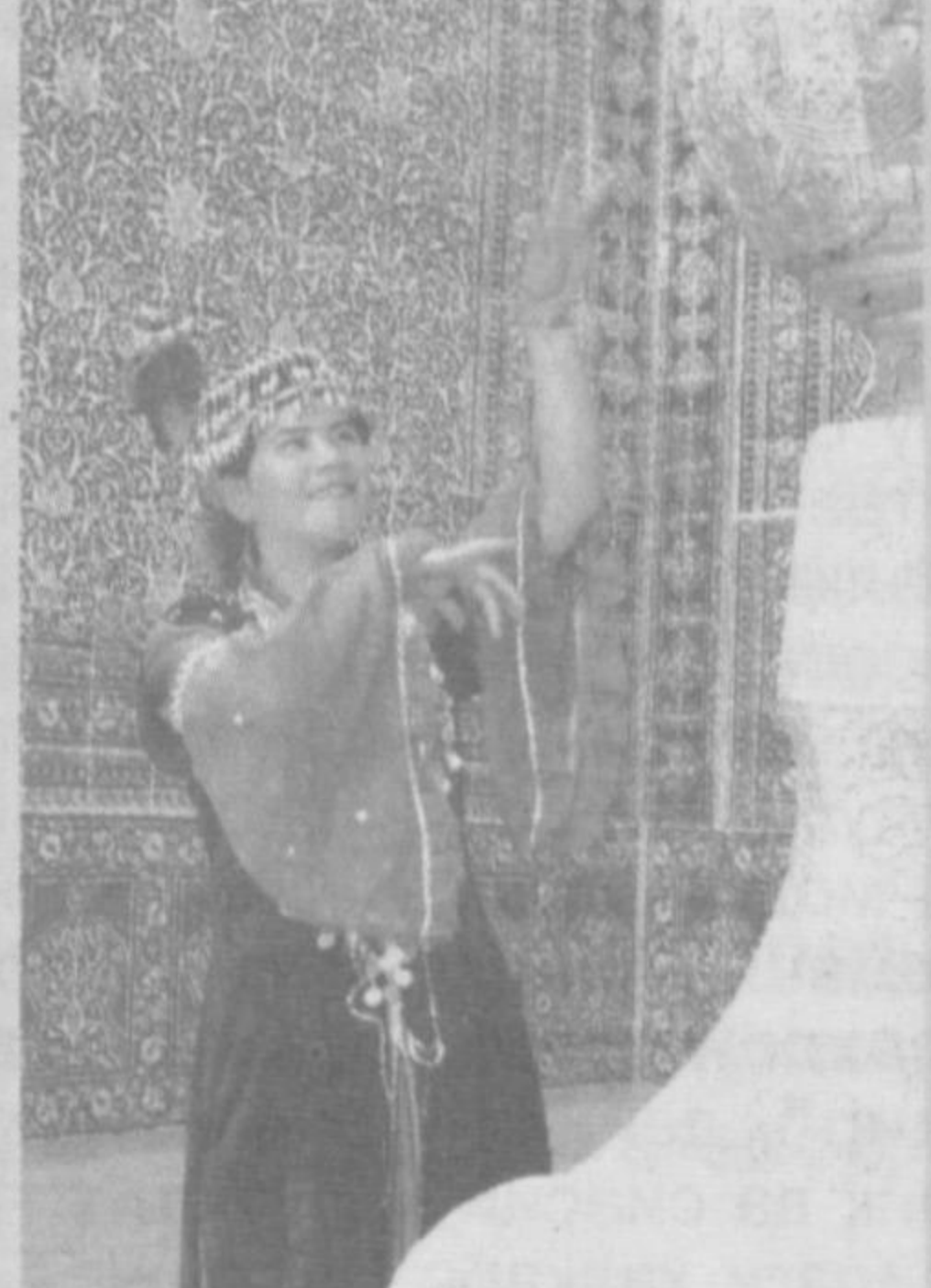
размшоҳнинг калтафаҳм ва худбинлиги боис Жалолиддиннинг қулларини бир жойга тўплаб, уюшган ҳолда жанг қилиш таклифи инобатга олинмади. Шу боис, Темур Малик ўз қуллари билан алоҳида мўғулларга қарши жанг олиб борди. У жуда кўп қаҳрамонликлар кўрсатди. Унинг мардлиги афсонага айланди. Богдоддан паноҳ толган Нигина эса, хоҳ Жалолиддин бўлсин, хоҳ Темур Малик, мабодо ўчраб қолса хабар етказишни тайинлаб, ўз даракчиларини ҳамма жойларга жўнатиб юборган эди.

Турон заманига қашқирдай қутуриб, қонсираб бостириб келган мўғуллар важоҳати Жалолиддин Манғуберди ва Темур Маликлардай жавонмуд эрларни чўчита олмади. Улар бор қулларини ақлига, билагига йиғиб, фанимга қарши мардона курашишга бел боғладилар. Лекин ўзини Искандари Соний деб атаган шох Аловуддин Муҳаммад, унинг арзидан ўғиллари ва «икки дунё хотинларининг подшоҳисман», деб ўзига бино қўйган жоҳил Туркун хотун ҳамда сон-саноксиз беку амирлар арқони-давлатини қарвонларига ортиб, онадай буюк Ватанларини ёғийлар оти тўёвига шундоқ топширганча қочиб қолдилар. Муҳаммад Хо-