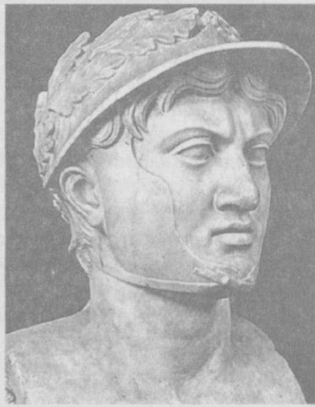
ернинг бир қисми, холос», — деб жавоб беради.

Қадимги юнон файласуфи Пиррон Элида шаҳрида туғилиб ўсган.