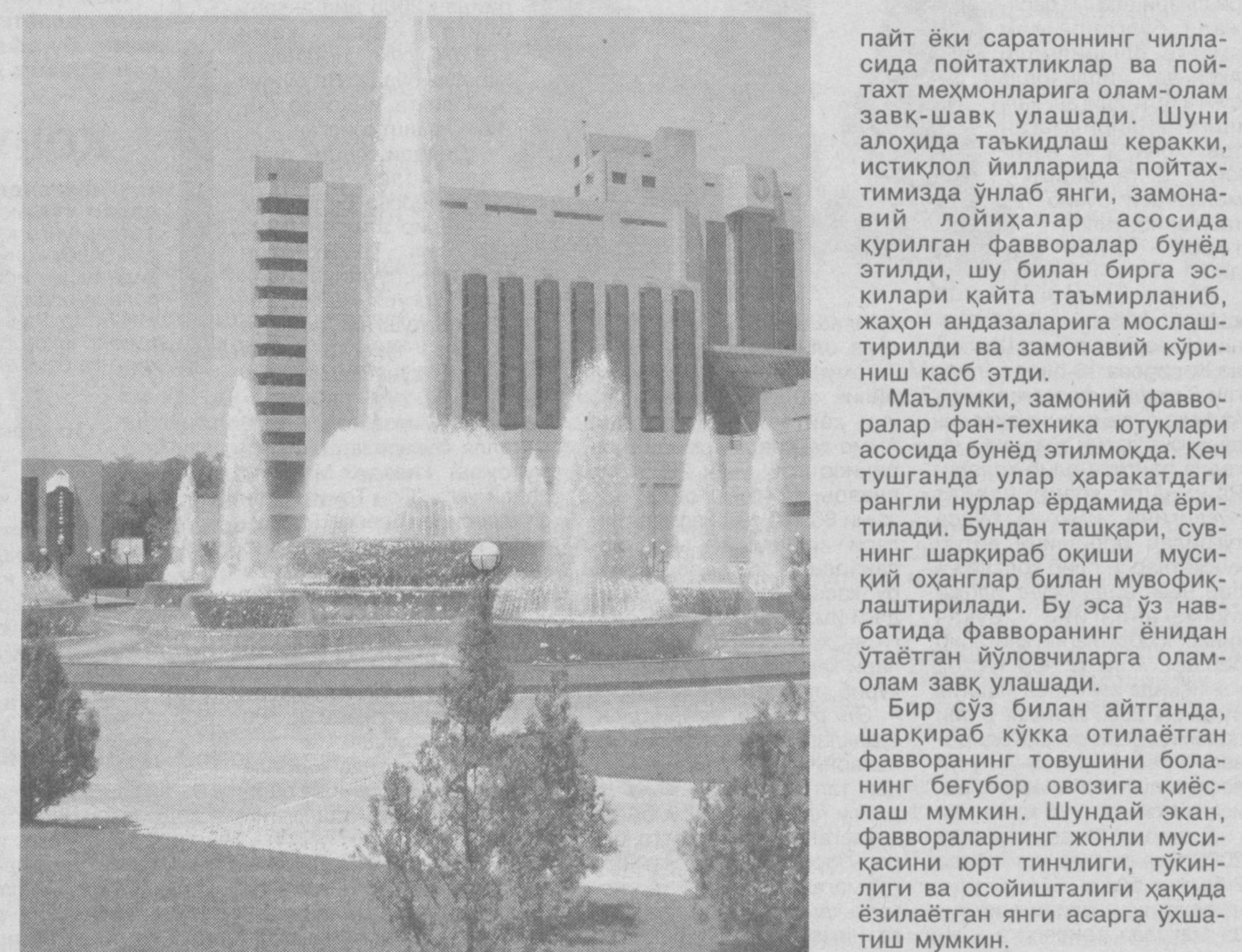
дони, Миллий боғ, Алишер Навоий номидаги Давлат Академик катта театри майдони, "Интерконтиненталь" меҳмонхонаси, Ҳадра майдони, Дархон мавзесидаги "Ғарбий соҳил савдо мажмуаси"нинг рангли фавворалари кечки