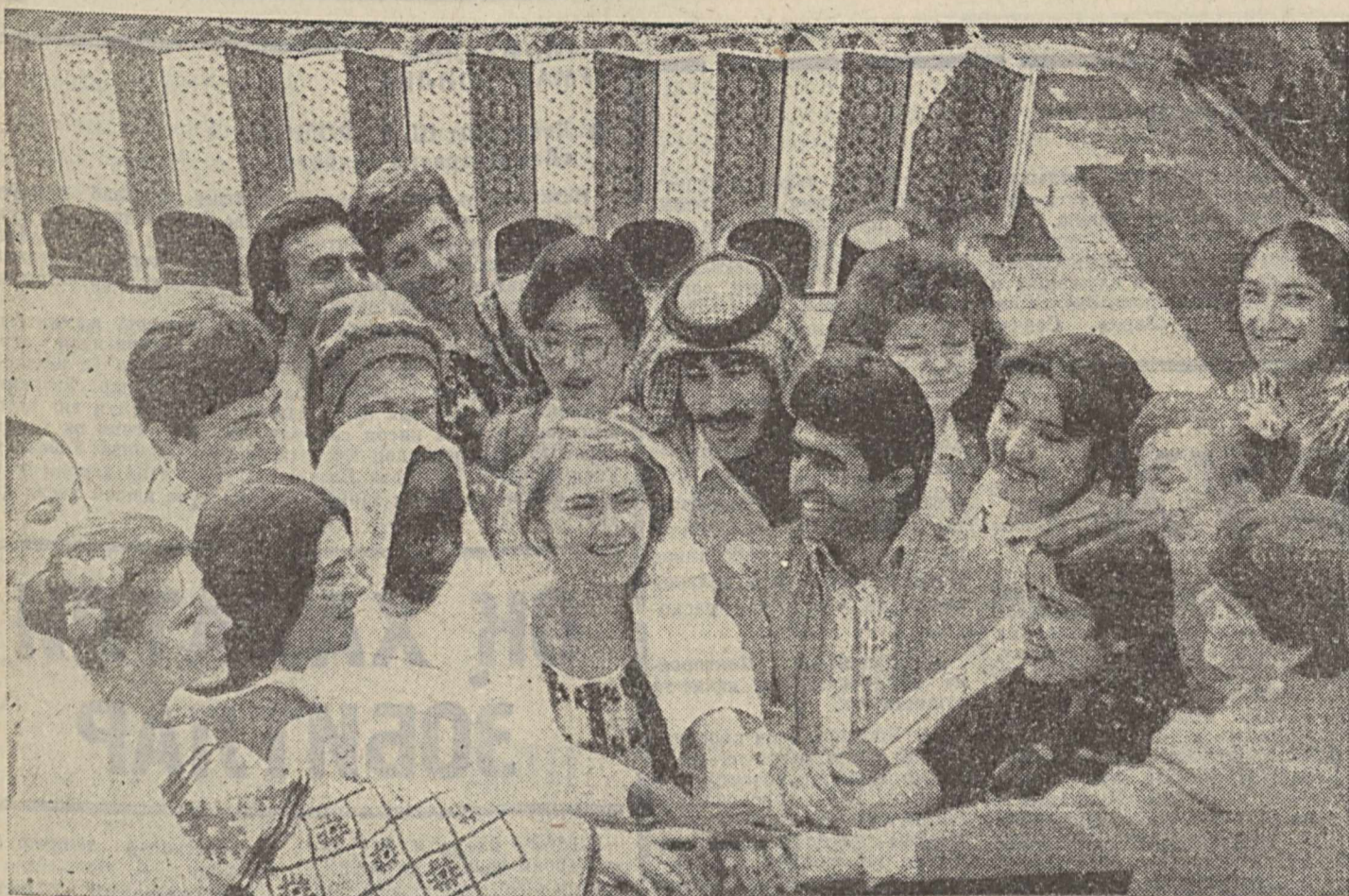
МАЗУНИ МУШТАРИЙ ТАНЛАДИ

Хурматлиқ редакция-ҳодимларим! Мен «Янгида Нурмухаммад Андалиб деган ўзбек шеъри ҳақида эшитиб қолдим. Андалибнинг «Ушқир» қалами соҳиб бўлиб, XVII ёки XVIII асрларда яшад, ижод қилган экан. Агар мумкин бўлса, Андалиб тўғрисида маълумот беришингизни сўрайман. Сизларга салом ва хурмат-эҳтиром ила Ўқитиб Худайберганаев, Тошкент Давлат Яхон тилларни ўқитиш институтининг тоғлиб, захираси қатта сержант.