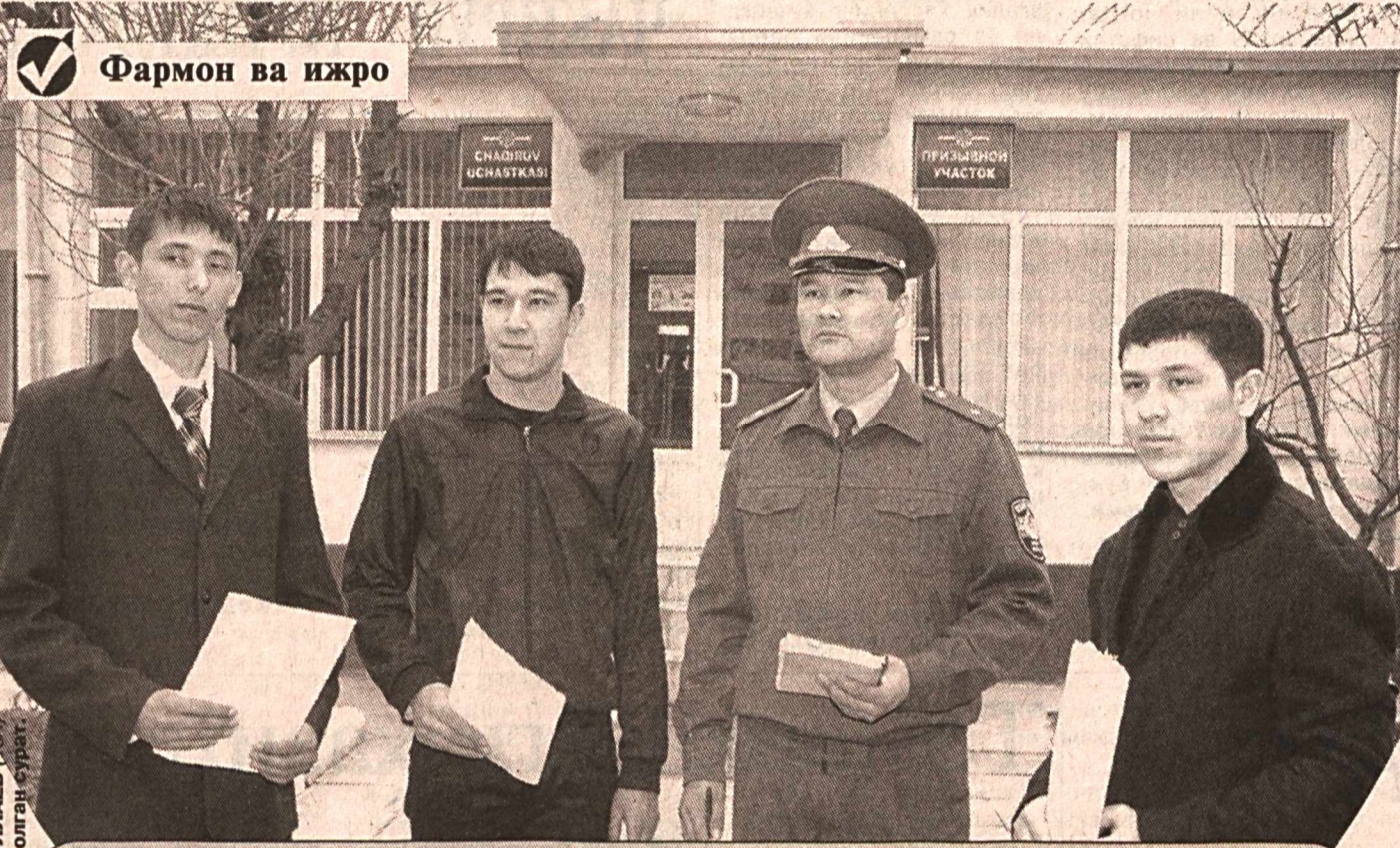
Муддатли ҳарбий хизматни ўташ тизимини такомиллаштириш, мудофаа ишлари бошқармалари чақирув пунктлари инфратузилмасини ривожлантириш, моддий-техник ашё ва тиббий особ-ускуналар билан жиҳозланишни янада яхшилашга алоҳида эътибор қаратилаётгани мамлакатимиз мудофаасининг янада мустақамланишига хизмат қилмоқда.

Президентимиз Ислам Каримовнинг 2008 йил 20 ноябрда қабул қилинган «Фуқароларнинг Ўзбекистон Республикаси Қуроли Кучларида муддатли ҳарбий хизматни ўташ шарт-шароитларини такомиллаштириш чора-тадбирлари тўғрисида»ги фармони бу борада муҳим дастуриламал