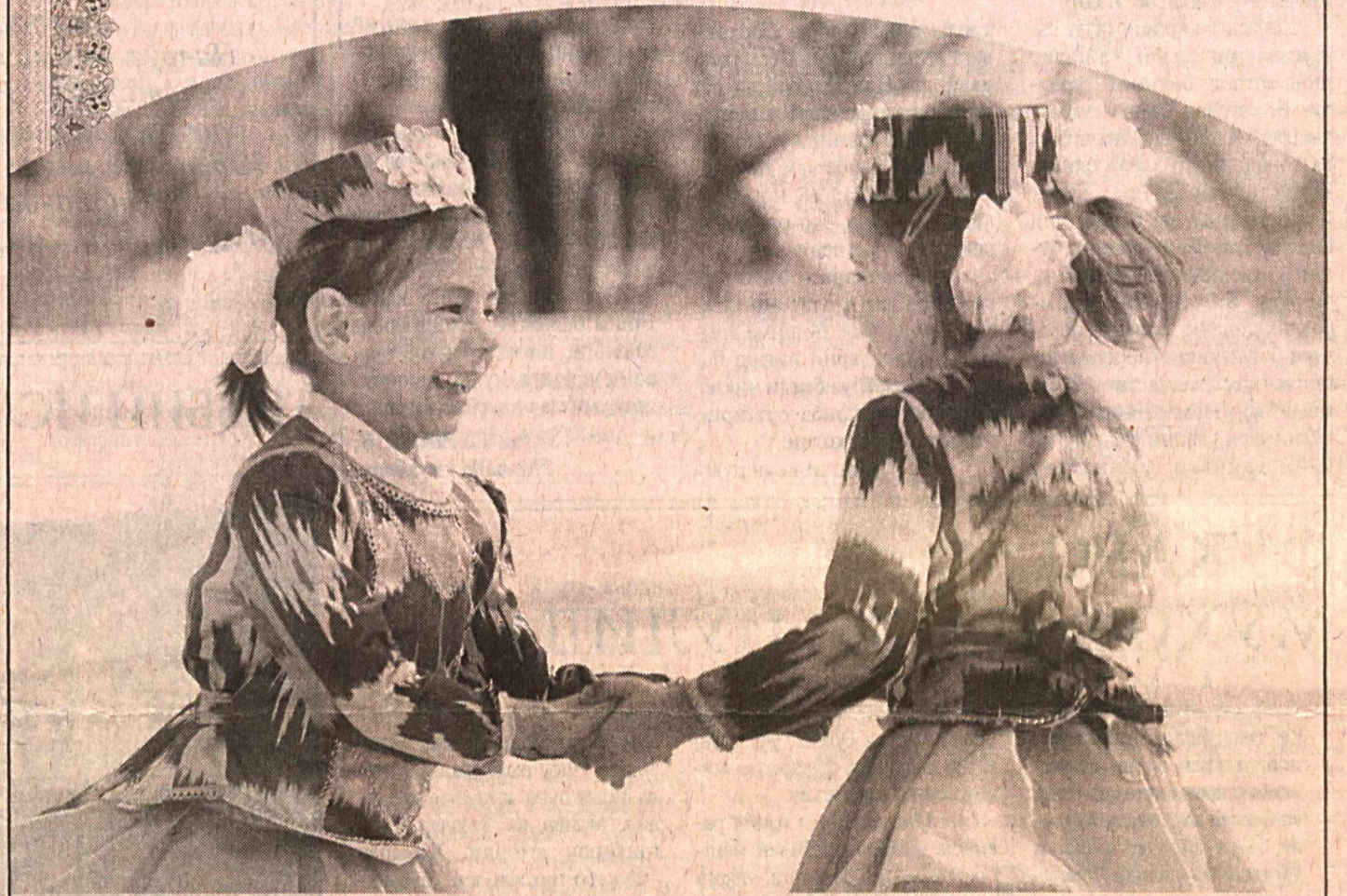
Наврўзингиз муборак бўлсин!

Наврий вилоятимиз бўлими жамъиати бағра юртидошларимизни юзгаллик ва нафосат, эзгулик ва меҳрибонлик байрами билан йил дилдан кутлайди. Яшарини фасти — Баҳор маҳаллаларимизда тинчлик, пўқимлик, элимизда бахт-саодат олиб келсин! Дилларимиздан меҳр-оқибат ҳел қалон афмасин.