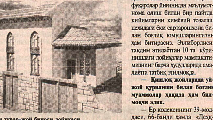
6 хонали 2 қаватли турар-жой биноси лойиҳаси