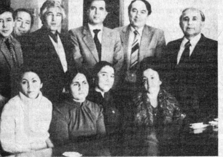
БЕЧМНИШГА АЙЛАНГАН ЛАХЗАЛАР

Етмиш беш йил... озми-кўпми! Албатта кўп. Дунёда энг кўп умр кўриб, деган бир одамнинг умрига тенг муддат. Ўзбекистонда, қолаверса, Туркистон ўлкасида илк бор чоп этилган бу газета ўзининг катта тўйини нишонлади.