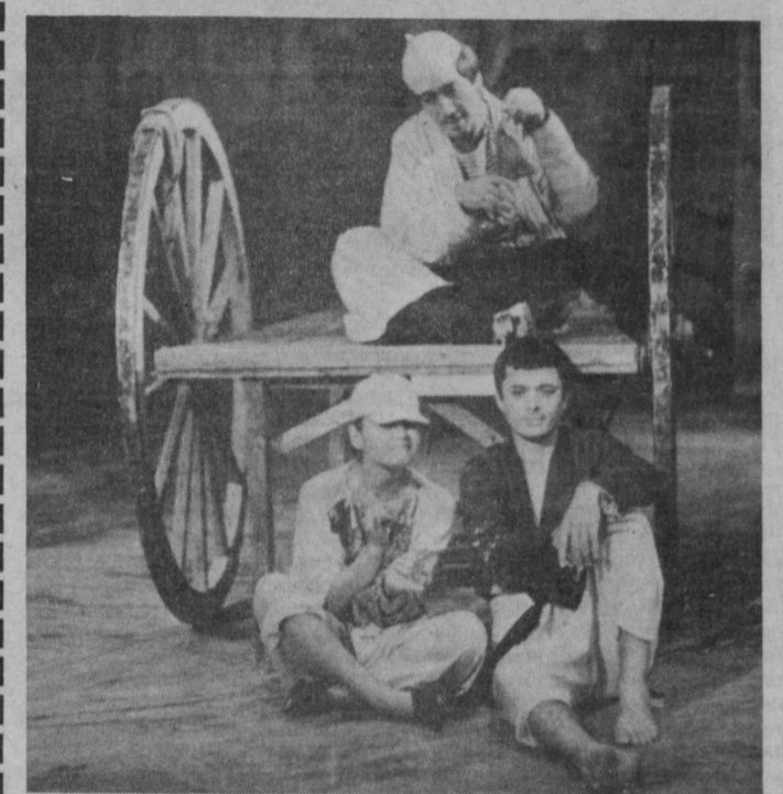
Менинг Ўзбекистон дилбар Ватаним!