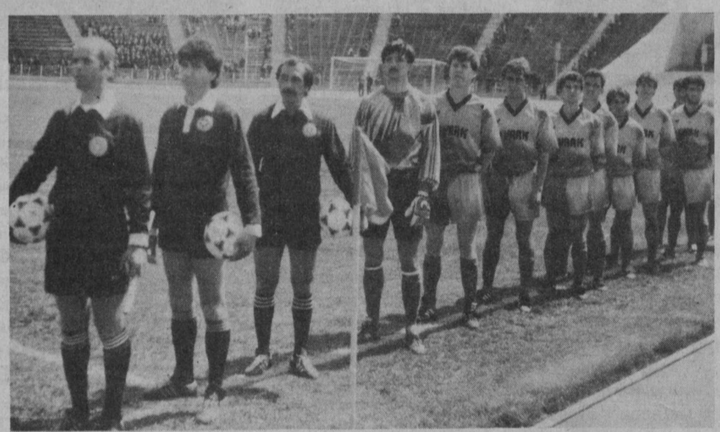
Уйинчилар бўлиб ўтган беллашувни таҳлил қилиш билан тонг оттиришди.

Гарчи «Нефтчи» сунги беллашувда мағлубият аламини тортган бўлса-да, унинг ярим финал учрашувларга чиқиши нақд эди. Айтганча, Катардаги уйинларда галаба учун уч, дуранлиқ учун эса бир очкодан бериб боришди.