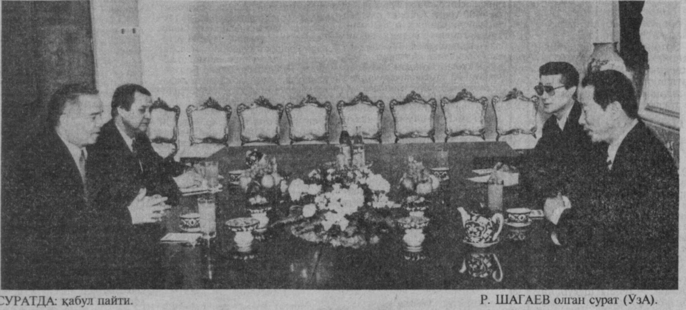
СУРАТДА: қабул пайти.

Се Ён И самимий қабул учун миннатдорлик изҳор этиб, корейлик ишбилармонлар Ўзбекистонга катта қизиқиш билдираётганини қайд этди. У мамлакатларимиз уртасидаги алоқалар бундан буён ҳам мустақамланиб боради, деб умид билдирди.