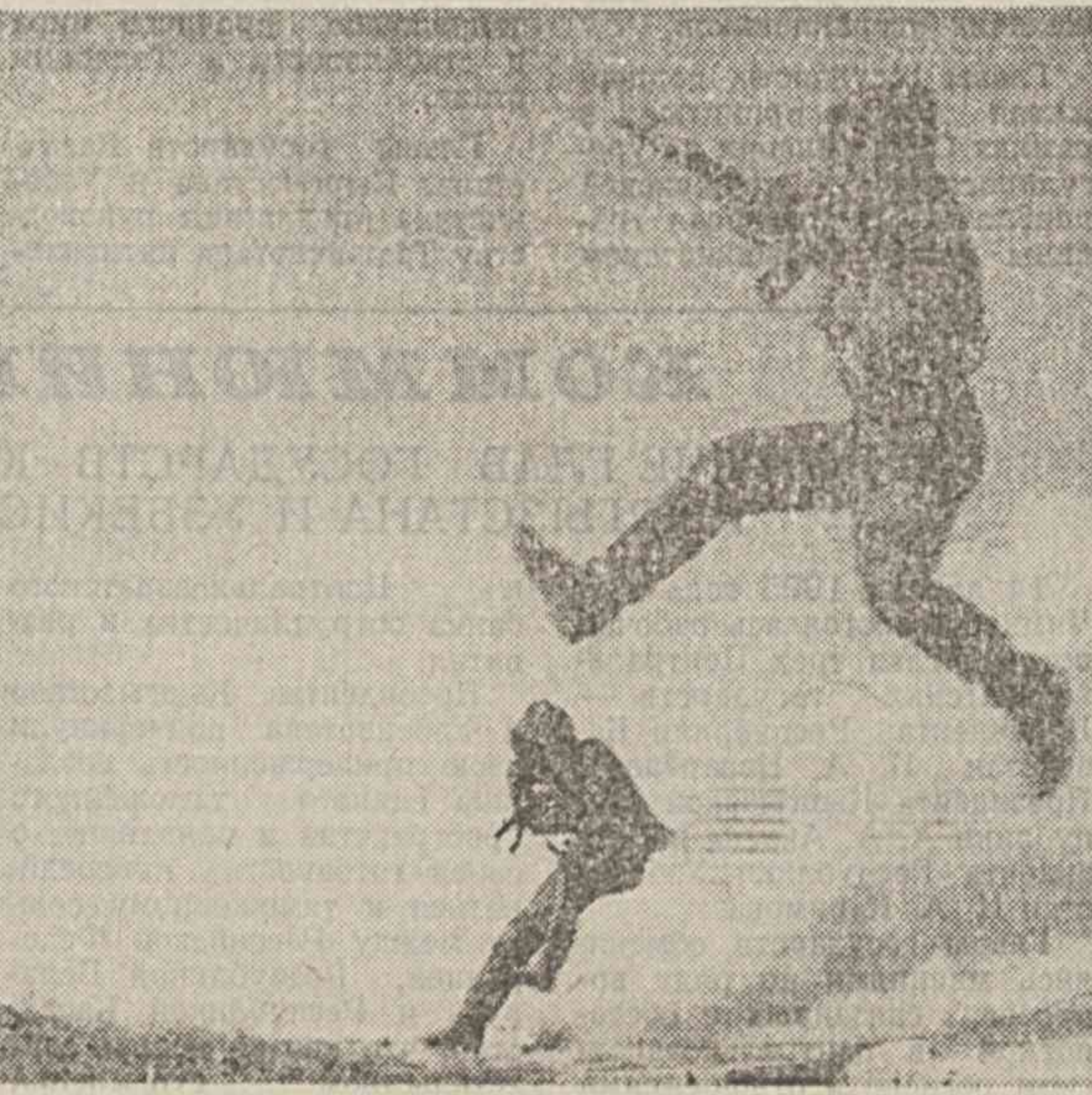
На контрольном занятии — воины-разведчики.