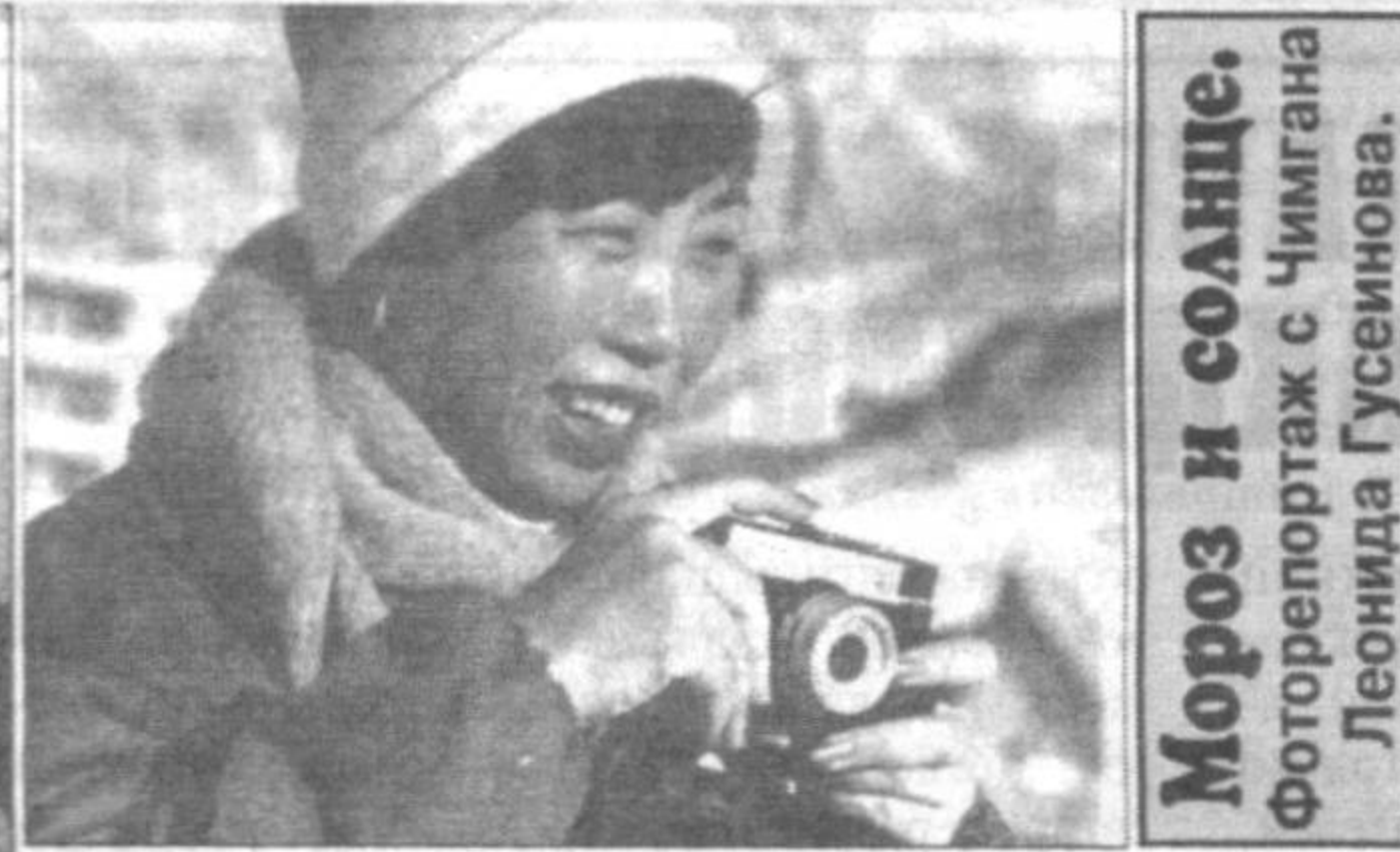
Мороз и солнце.