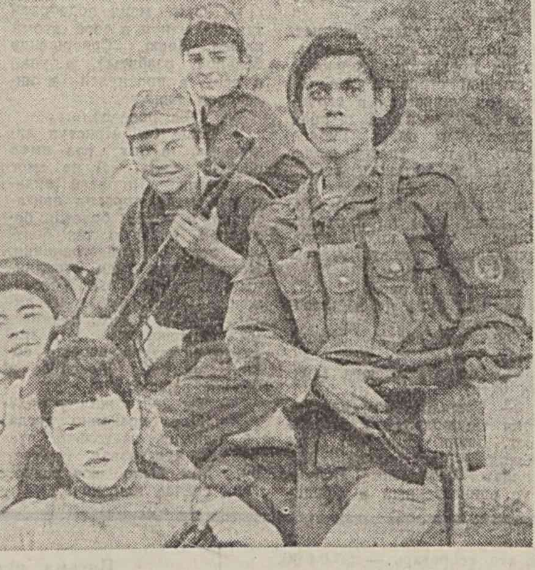
За прошедшие десять лет уже более 120 выпускников клуба стали офицерами, сотни прошли службу в армии...