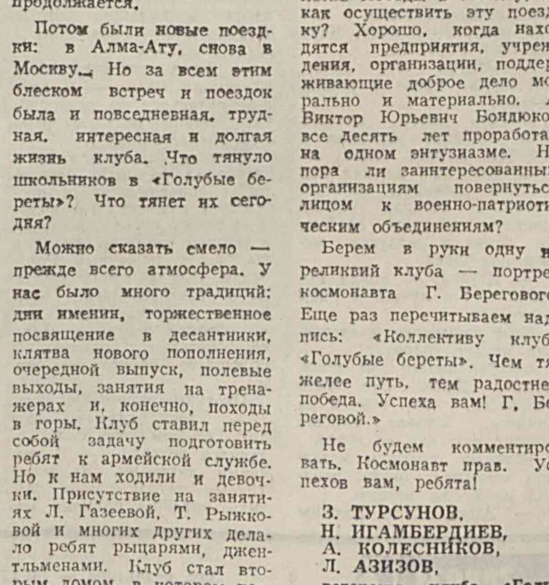
За прошедшие десять лет уже более 120 выпускников клуба стали офицерами, сотни прошли службу в армии...