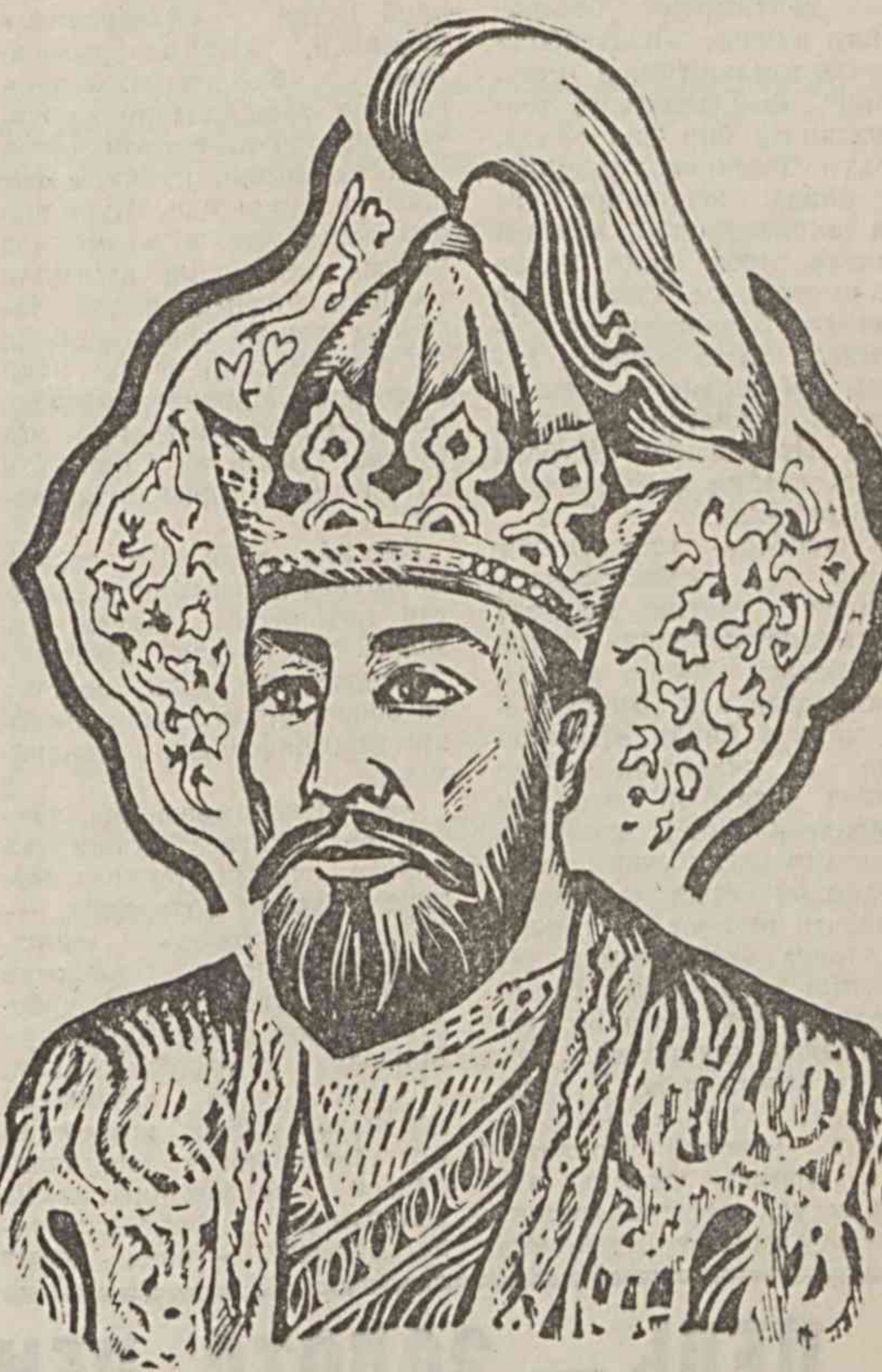
(Давоми. Боши ўтган сонларда.)

ва мактаблардаги каби бу ерда ҳам ватанпарварлик, байналмидал дўстлик, филокорлик, шижоатлик, меҳорнатсеварлик руҳида меҳор топадилар.