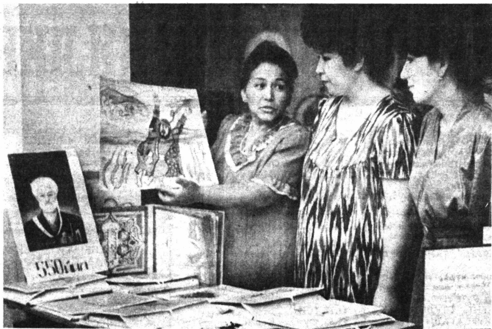
Сураткаш Р. АЛБЕКОВ.

• Алишер Навоий йилида кўчилик ташкилотлар, муассасалар қатори пойтахтдаги 218-ўрта мактаб муаллимлар жамоаси ҳам сермазмун тадбирлар ўтказмоқдалар. Суратда: ўқитувчи Феруза Салимова ўз шогирдларига буюк даҳонинг асарлари ҳақида дарс ўтганда фойдаланиладиган кўргазмали қуроллар тўғрисида маълумот бермоқда.