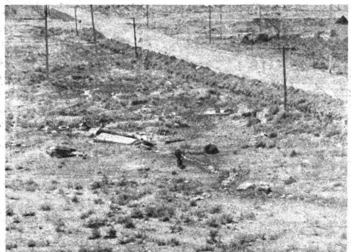
Филиал чиқиндилари атроф-теваракни булғатиб ётипти.