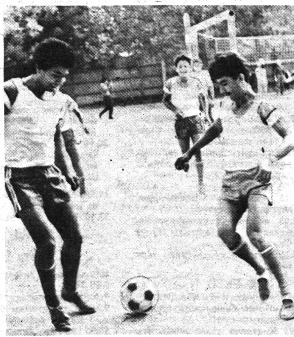
футбол командасининг машҳур ўйинчиси, кейинчалик моҳир ўқитувчи бўлиб етишди. Мактабнинг юқори синф ўқувчилари шаҳар биринчилигида