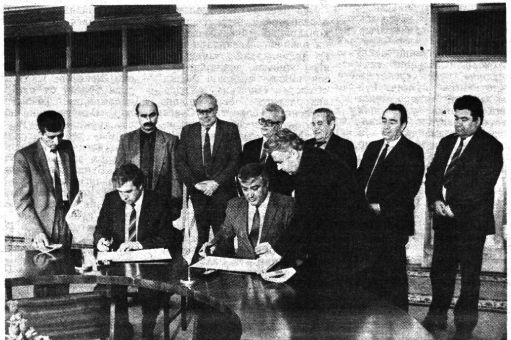
СУРАТДА: битимни имзолаш пайти.