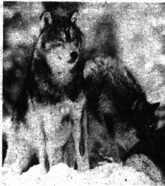
Уни оёқлари боқади.