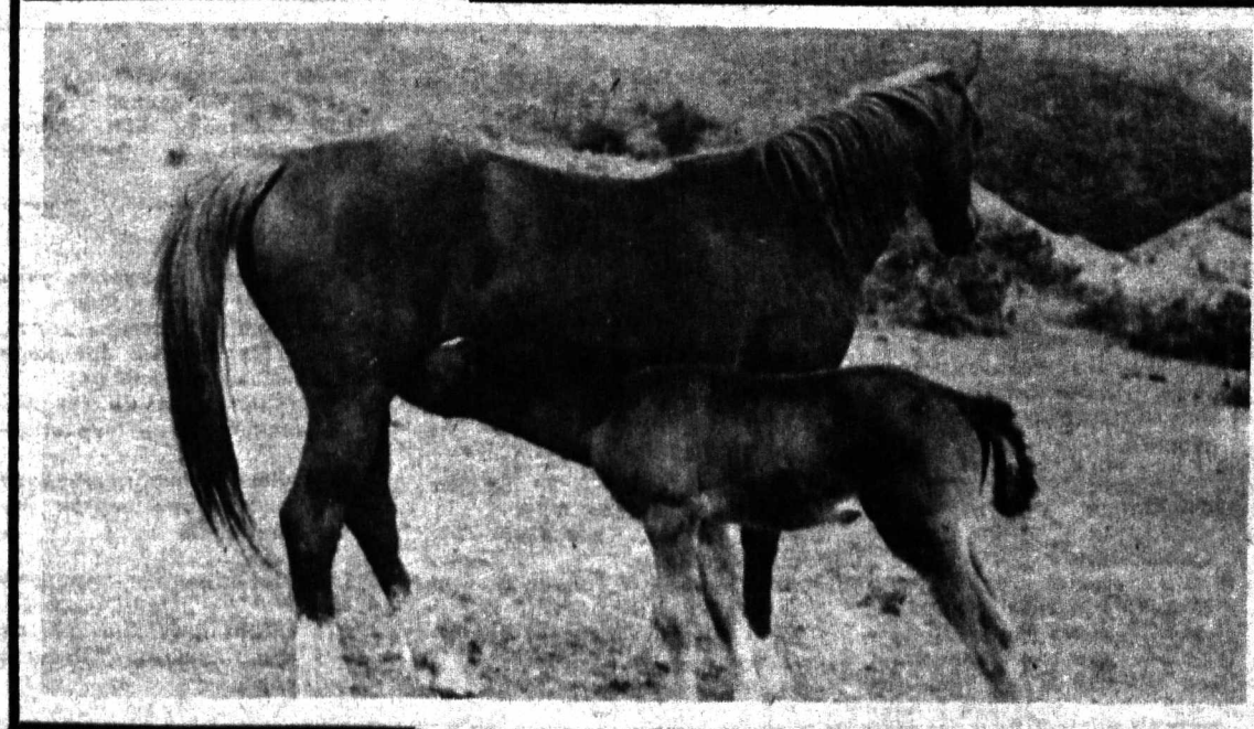
Кенг жўзон бағрида

корхоналарда экологик аҳволни яхшилаш учун назоратни кучайтириш, бунга кенг жамоатчиликни жалб қилиш, касабат уюшмалари тармоқ вилоят кўмиталари меҳнат — техника хавфсизлиги бўйича йўриқчилари билан рейд ҳамда текширишлар уюштириш ва бошқа муҳим масалалар қамраб олинди. Масъулиятни оши-