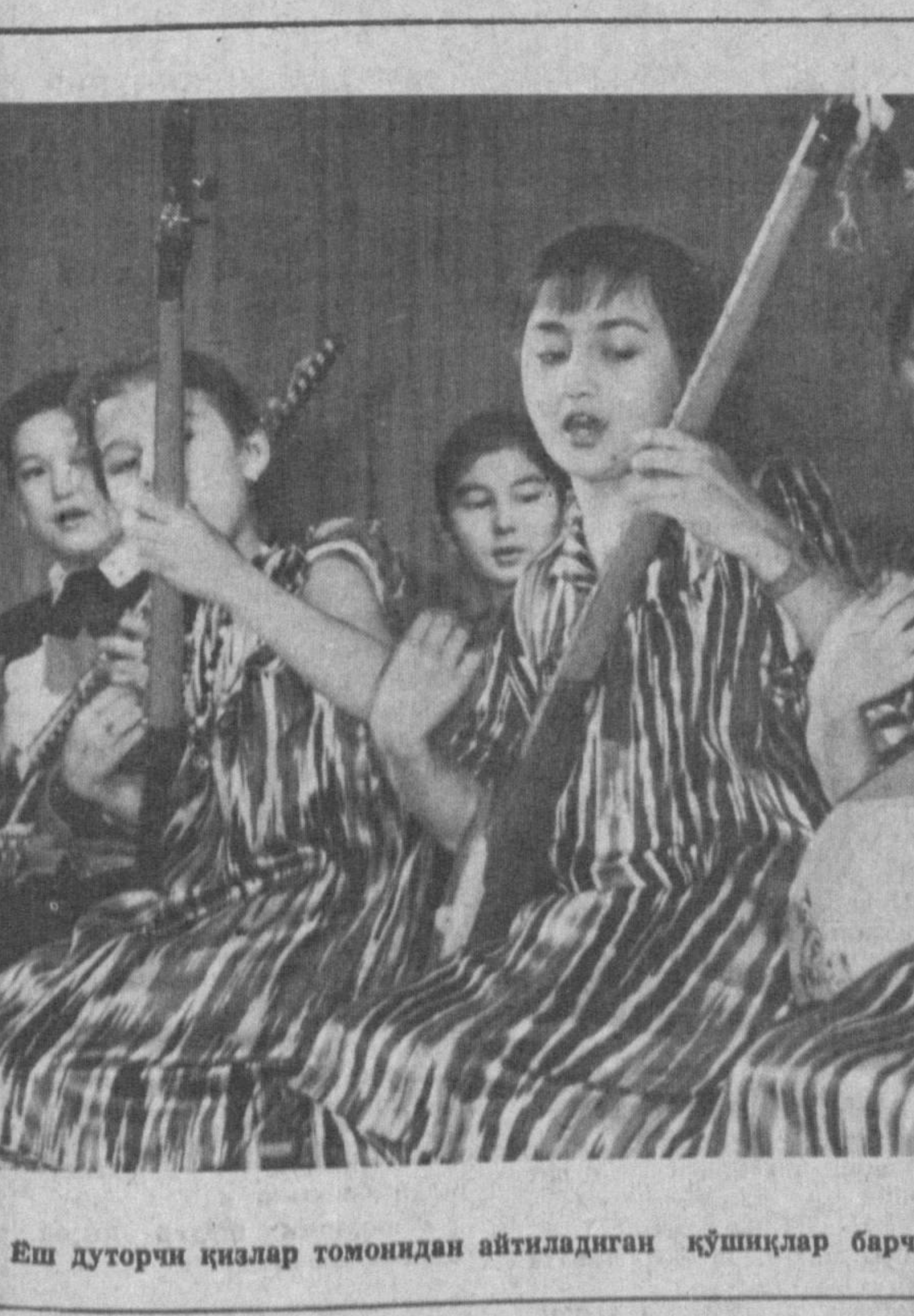
Еш дуторчи қизлар томонидан айтилидиган қўшиқлар барчага манзур бўлмоқда.

© Ўзбекистон ССР Соғлиқни сақлаш вазирлиги педиатрия илмий-тадқиқот илмгоҳи ташкил топганига 25 йил тўлди.