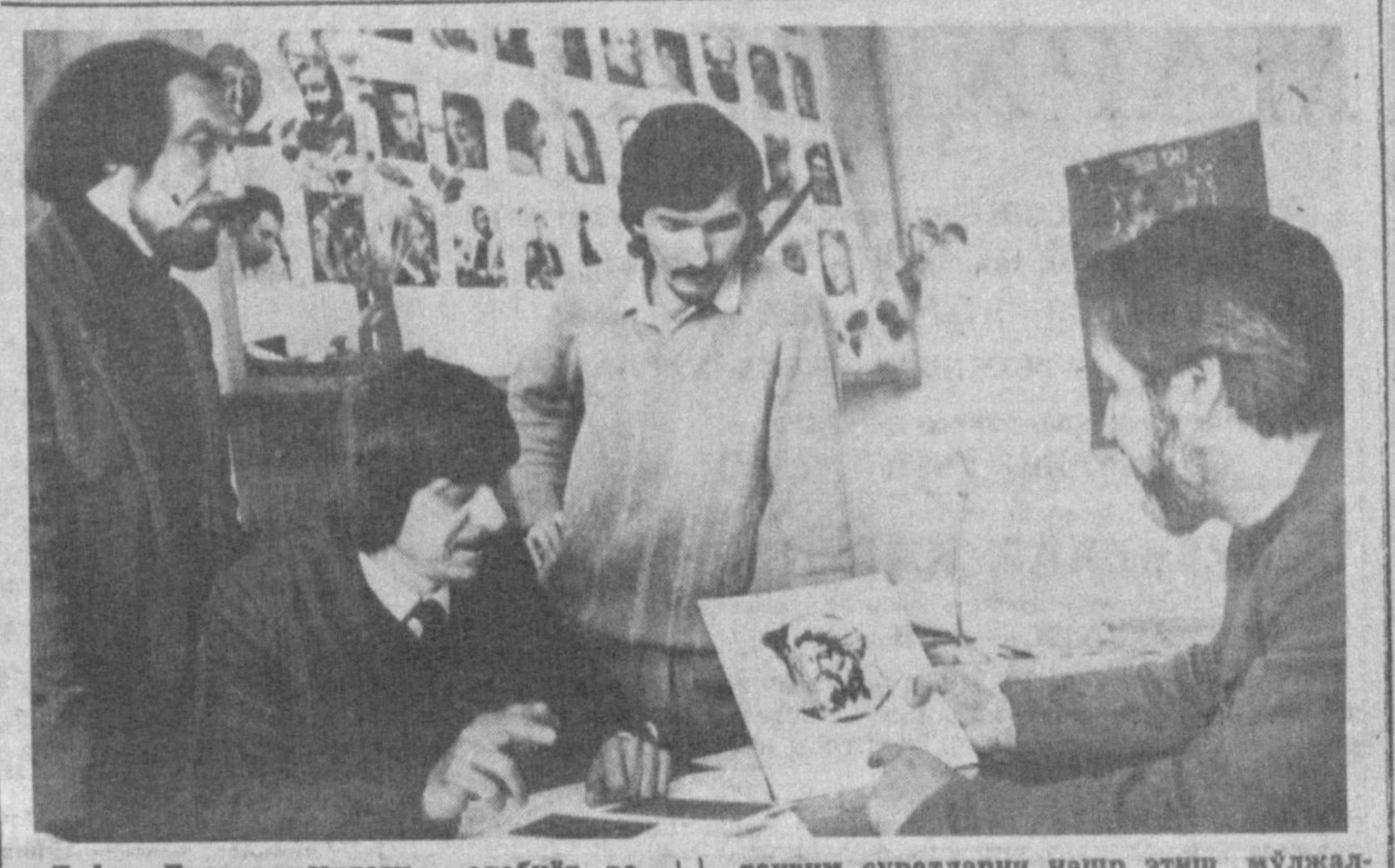
Фафур Гулом номидаги адабиёт ва санъат наشريётида буюк мутафаккир Алишер Навоий кутуб тўғи тантаналарига катта тайёргарлик қўрилмоқда.