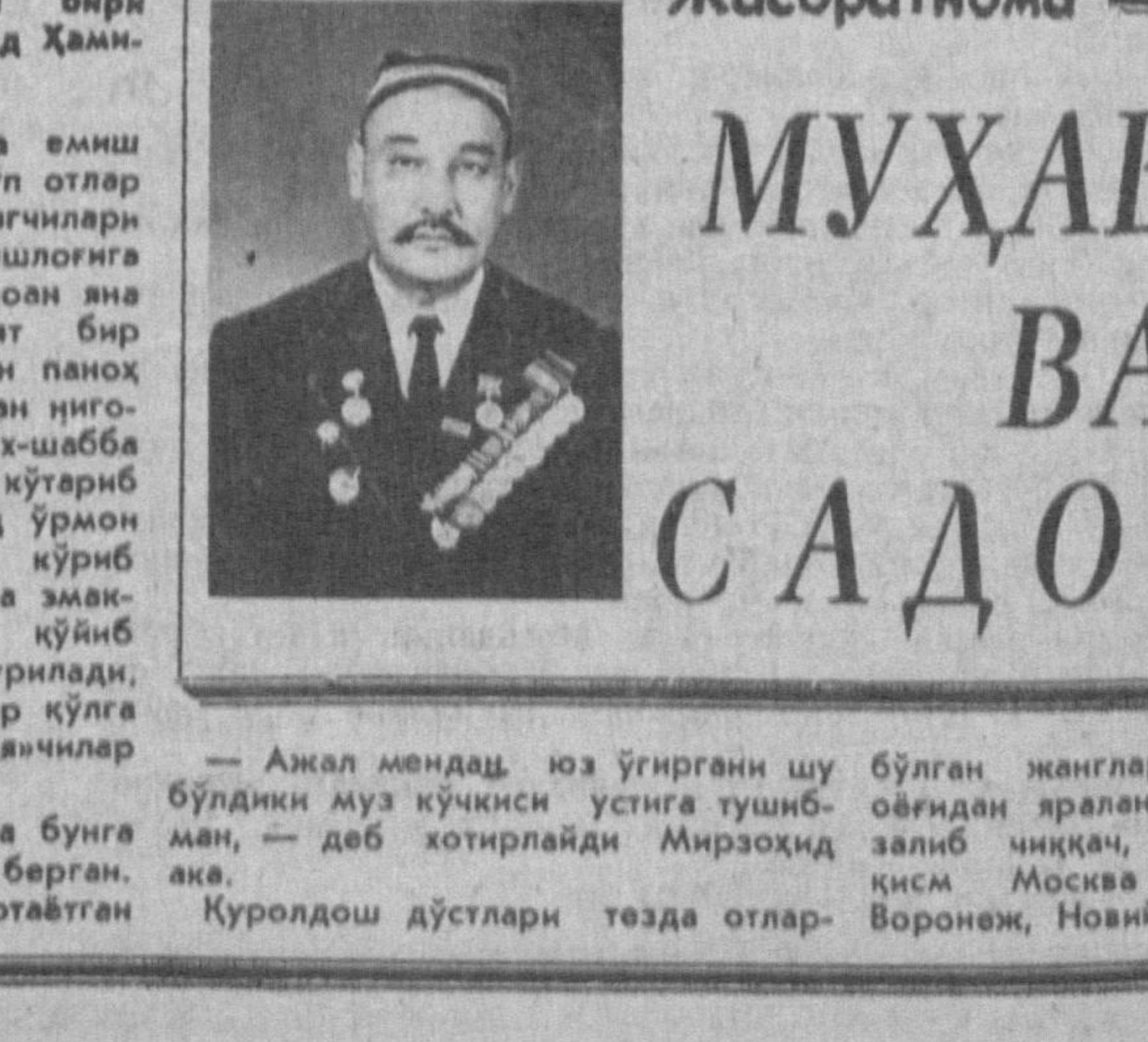
— Анжал менда юз ўнгирини шу бўлдики муз кўчкиси устига тушиб...