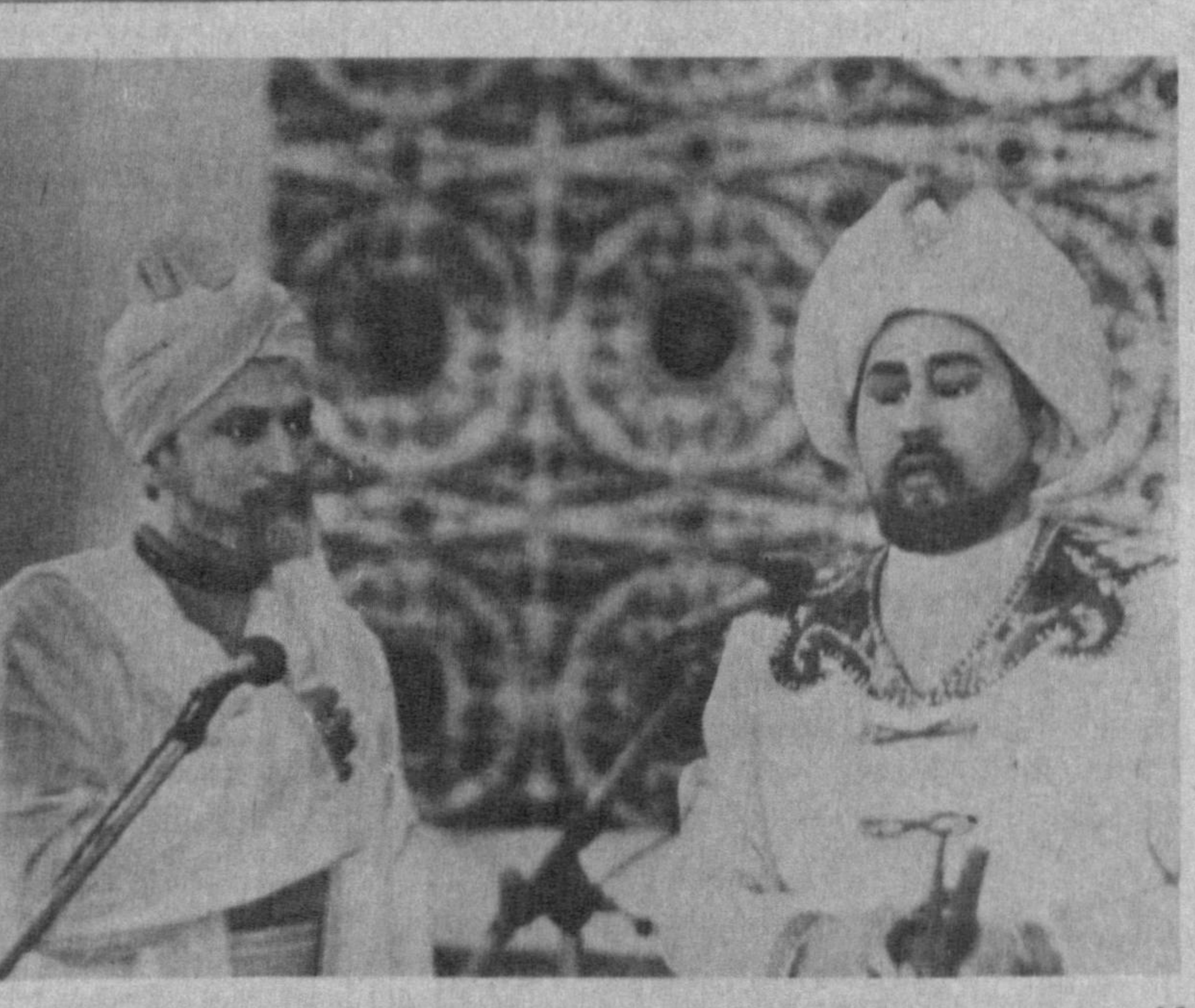
С. Раҳимов районидеги 243-мактабда навоийхонлик кечаси бўлиб ўтди. Район миқёсда ўтказилган бу мусяқавий кечга Навоий ва Бобур образини яратган Ҳамза номидаги Ўзбек Давлат Академик драма театрининг етук актёрлари

Уш ишлаб чиқариш корхоналарининг аппаратчаси, со-вутини курилмалари ремонт ва уларга хизмат кўрсатиш бўйича чиқилар, қандолатчи-новий, қандолатчилар. ЎҚИШ МУДДАТИ: 11 синф маълумоти бўйича — 1 йил. 8 синф маълумоти билан — 2 йил.