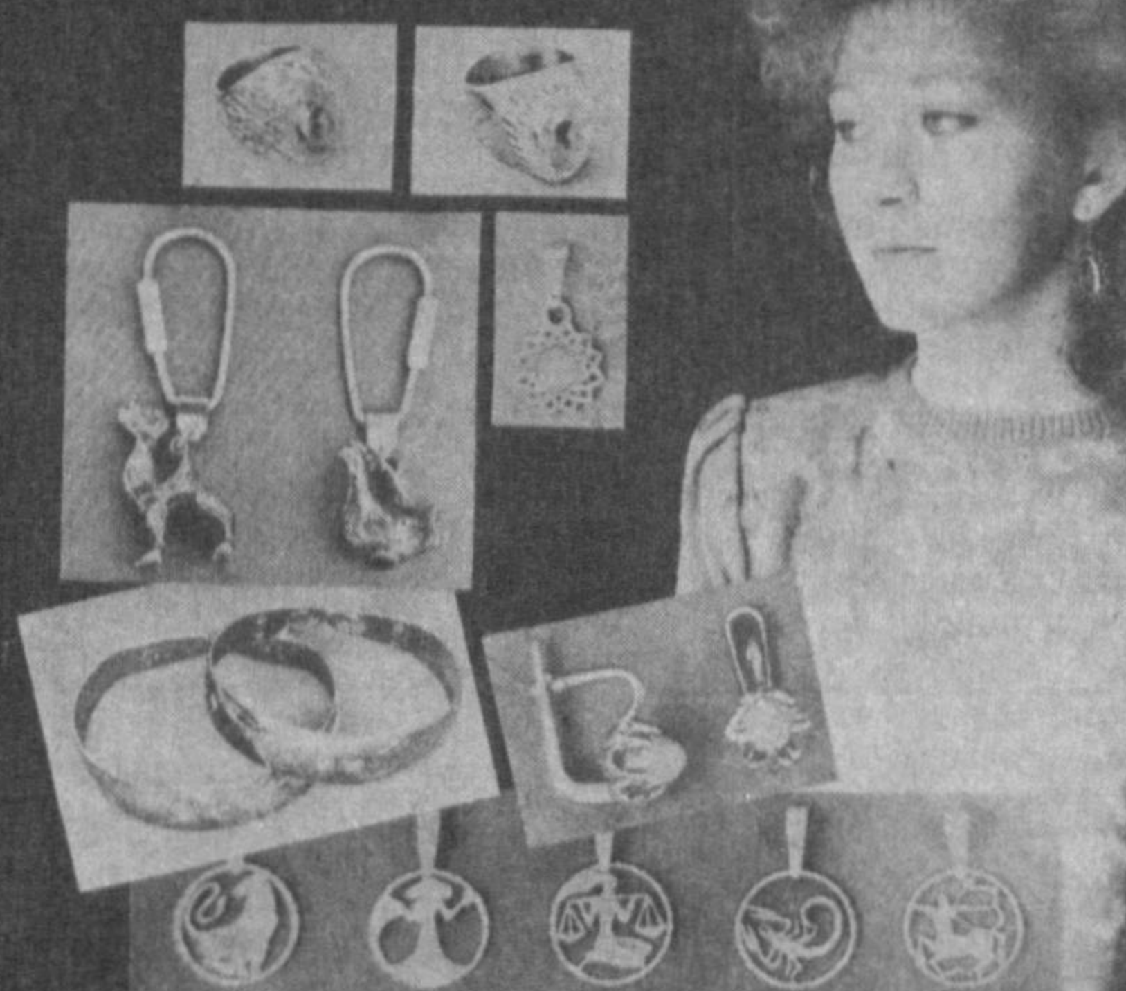
Заргарлик буюми сиз билан бизни, фарзандларимизни, ахтироқ эрдан йиллар ўтиб авлодларимизни мафтун этадиган, уларни қувонтирадиган зийнат буюми даражасига эришиш учун қўлаб қўлардан ўтади. Ўз набатига ҳар бир иш жойида заргарона ноҳил юмш бажарилган. Натияжада — ТОШКЕНТ ЗАРГАРЛИК ЗАВОДИНИНГ ЗЕБ-ЗИНАТЛАРИ ТУРКУМИ яратилади. Улар кўп йиллар одамларга хизмат қилади.

Совгабон брелоклар ҳам заводда рассом ва заргарларнинг маҳорати, ижодий ҳамкорлиги натижасида яратилган. Уларда митти жаннат қушлари, қувноқ ва айёр Ҳўжа Насриддин ўз эшигидеги ўтирини минган алмонга нампир, илон ўргатувчилар, мунажжимлар, қумгончалар тасвирланган.