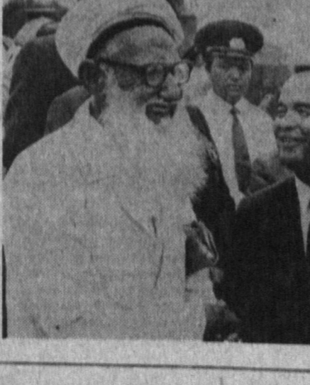
(Давоми иккинчи бетда).

Кеча Москвада «Пактфор» ва «Спартак» (Москва) жамоалари ўртасида рақибларимизнинг Японияга қўйиб кетиш-ларини муносабати билан қолдирилган биринчи давра ўйини бўлиб ўтди.