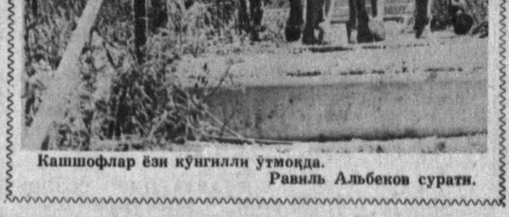
Кашшофлар ён кўнглили ўтмоқда.