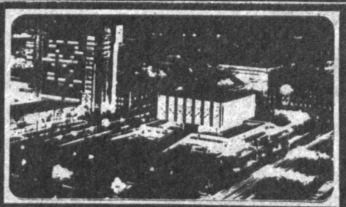
Ўзнома 1966 йил 1 июлдан чиқа бошлаган

Югославияда Словения ва Хорватия билан ўт очилиш тўғрисидаги битим имзоланганига қарамасдан қонли тўқнашувлар давом этапти.