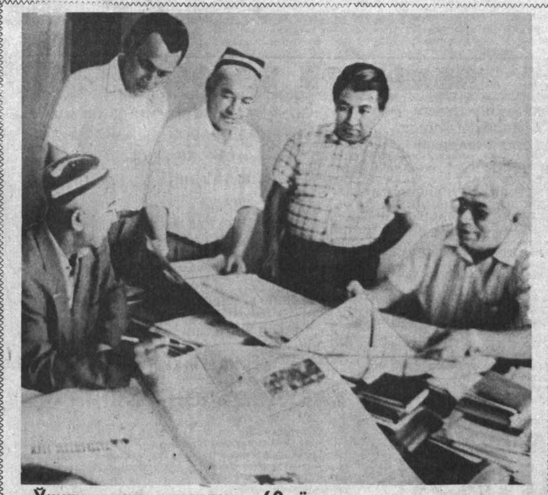
«Ўқитувчилар газетаси»—60 ёшда