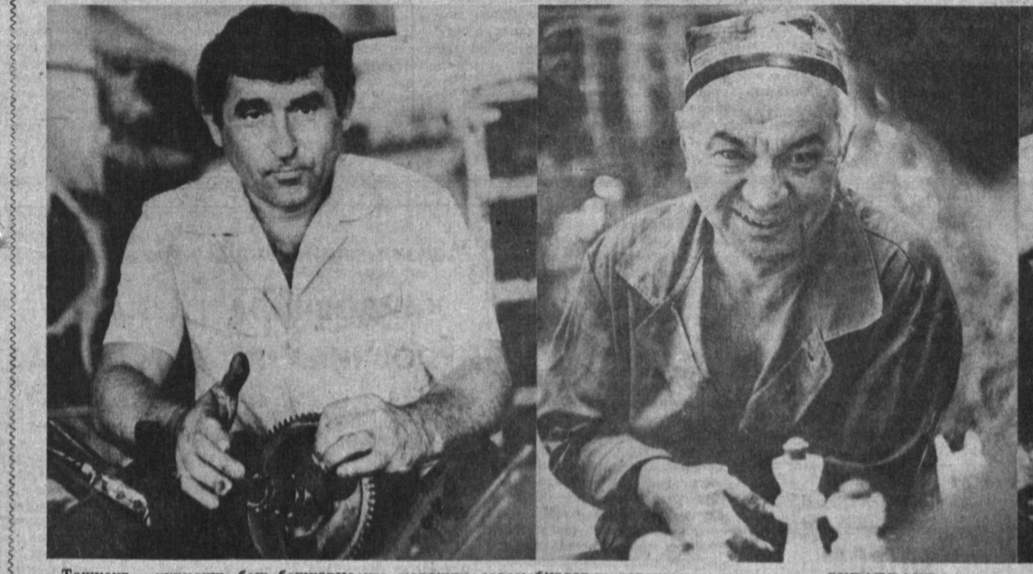
Тошкент қурилиш бош бошқармасига қарашли автомобилларни таъмирлаш корхонасида кўлаб сергайрат ишчилар меҳнат қилишадди. Уларнинг ёрдамида йил давомида 60 дан ортқ тиргачлар ишлаб чиқарилади.

Тошкент қурилиш бош бошқармасига қарашли 4-трестнинг 6-қурилиш бошқармаси қурувчилари шаҳарнинг Жуковский кўчасида 50 кишига мўлжалланган қаҳвахонани фойдаланишга тахт қилиб қўйдилар. Унга ташриф буюрадиган кишилар бу ерда тайёрланадиган ҳар хил ширинликлардан, яхна ичимликлардан тотиб кўришлари мумкин. Қаҳвахона қурилишига жами 250 минг сўм ажратилган. Шундан 213 минг сўми қурилиш-тиклаш ишларига сарфланди. Трест пардозловчилари эса жами 58 минг сўмлик пардозлаш ишларини амалга оширдилар.