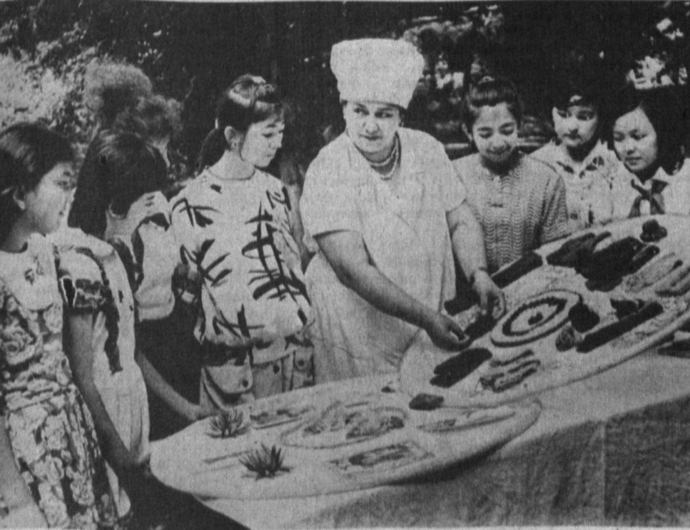
Киров районидеги 1-болалар санаторийида 130 бола дам олади. Бу ерда ҳар хил тўғараклар ишлаб турюбди. © СУРАТДА: 25 йилдан бери ана шу