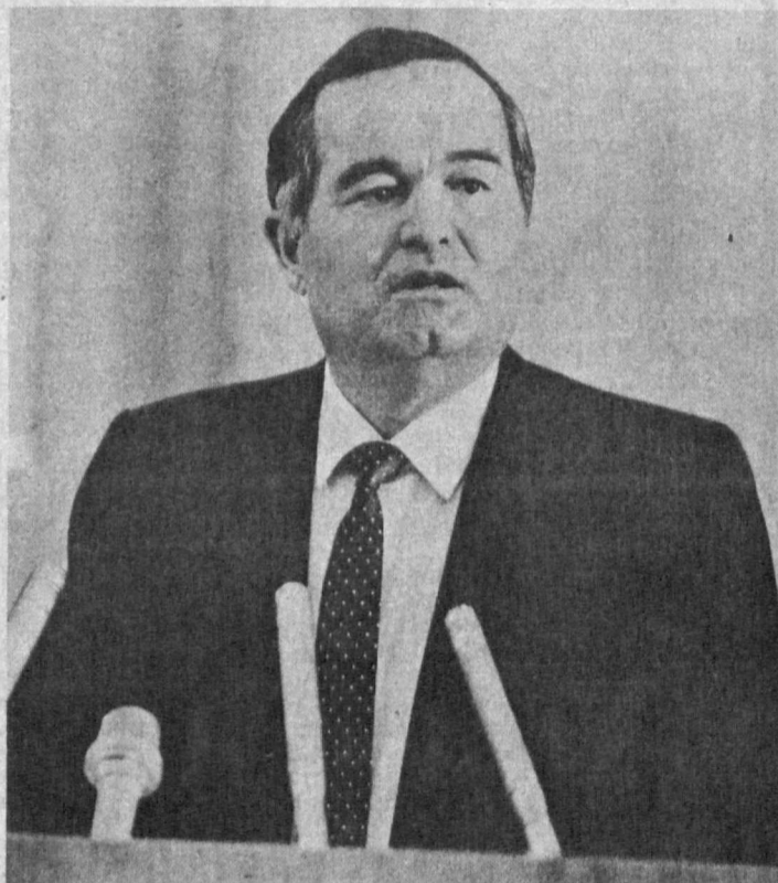
Ташкент, 31 августа. Шестая сессия Верховного Совета Узбекистана двенадцатого созыва.