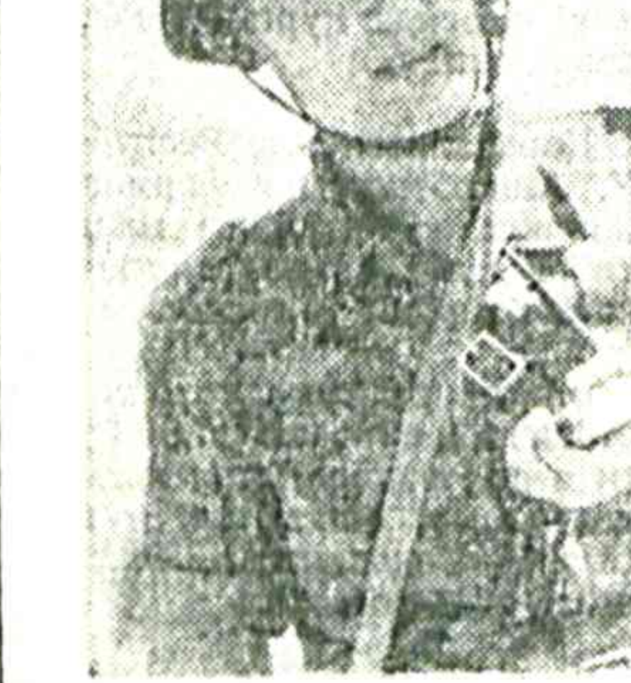
«Жаркая» сейчас пора у войны-ремонтничи — дет- ля боевая учеба в самом разгаре. В учебных классах и на полигонах отработа- ют они свое ратное мастер- ство, учатся по-настоящему военному делу.

Каждый из претендентов на звание лучшего водителя должен был справиться с