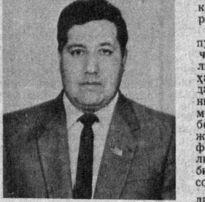
Ражаббой Нўлдошев, Қорақалпоғистон Республикаси Вазирлар кенгашининг раиси

Халқларимиз ўртасидаги мустақам дўстлик тарихининг илдири миғ йилларға бориб тақалади. Қадим-қадимдан тили, дини, маданияти, урф-одаги, мақсади бир бўлган, қиз олим, қиз берган, қуда андаю, қариндош — туғилган бўлиб кетган дўстларнинг бугунги учрашуви ҳаммамиз учун ҳам қатга байрамдир. Биз шу пайтгача неки ютуққа, неки ғалабаға эришган бўлсак, буларнинг барчаси ҳам ана шу дўстлик, қарошлик ва ҳамжиҳатлик туғайлидир. Хўрматли Президентимиз Ислам Абдуғаниевич Каримов ҳам ўзининг ҳар бир нуғтида халқлар ўртасидаги дўстлик, аҳилини, тўғрисида гапирди. Бугунги нотинч даврда бу сўзларнинг олтиндан ҳам қиммат эканлиғи ҳеч кимға сир эмас. Чўнки ҳар бир хонадонға, овулга, районға, вилоятға, қолверса, бутун давлатимизға тинчлик, бирлик сув билан ҳаводек зарур. Ҳамжиҳатлик йўқ жойдан тинчлик ҳам, барақа ҳам қочади. Соёқ Иттифонинг турли регионларида бугунги кунда содир бўлатган миллатларро низолар, қирғинлар бунинг исботидир.