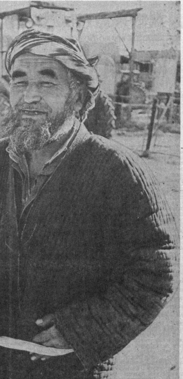
Илғари тракторчини кўпчилик менсимасди. Олди кийингани, мойга ботиб юргани учунмас...