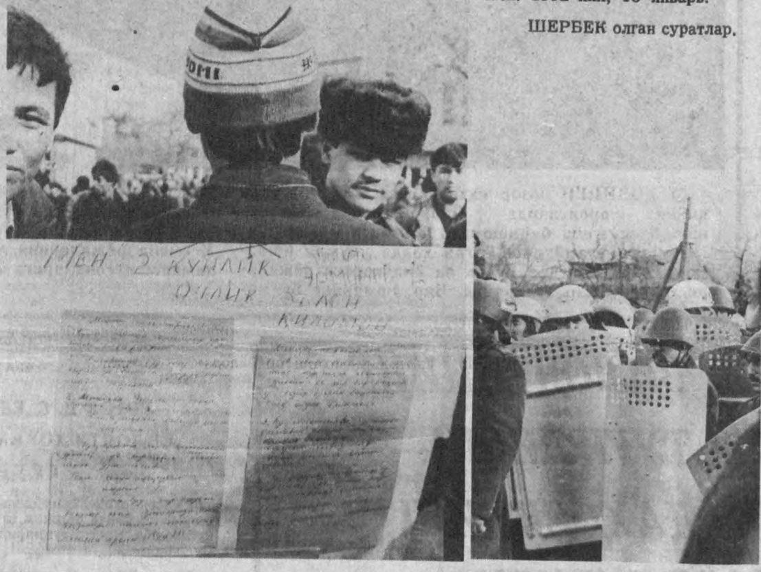
ТОШКЕНТ. Талабалар шаҳарчаси. 1992 йил, 16 январь. ШЕРБЕК олган суратлар.

Республикамизда Сиз амалга оширишга миллий ҳамжиҳатлик, тинчлик-тотувилик, ҳақиқий мустақиллик ва демократия сари ҳақдама-бақаддам яқинлашиб, исзил интилиш йиғилишидан биз — йиғилиш қатнашчилари, шаҳримиз фуқаролари манаун эканлигимизни изҳор этамиз. Аммо кутилмаган воқеа — Талабалар шаҳарчасида юз берган фожиа бизни бениҳоя изтиробга солди.