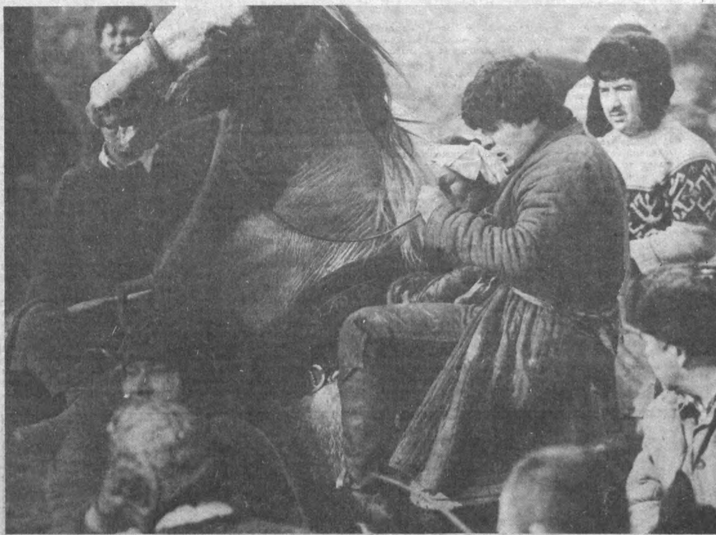
ЭКИШ мавсуми бошлангунга қадар ҳар кунни қишлоқларда бирор табдир ўтказилиши одат тусига кирган. Бу аҳолининг кўнгалдагидек ҳордиқ чикаришида қўл келаяпти. Навбатдаги худди шундай табдир Наманган вилоятининг Задарё районида ташкил этилди. Кўпқари мусобақасида қўшни районлардан келган улоқчилар ҳам иштирок этишди.