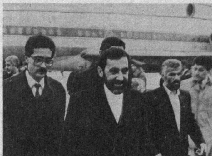
СУРАТЛАРДА: Али Акбар Вилоятӣ Ташкент аэропортида

1 февраль кун Эрон Ислам Ҳужумари ташқи ишлар вазири Али Акбар Вилоятӣ раҳбарлигидаги Эрон Ислам Ҳужумари делегацияси Ўзбекистон Республикасига келди.