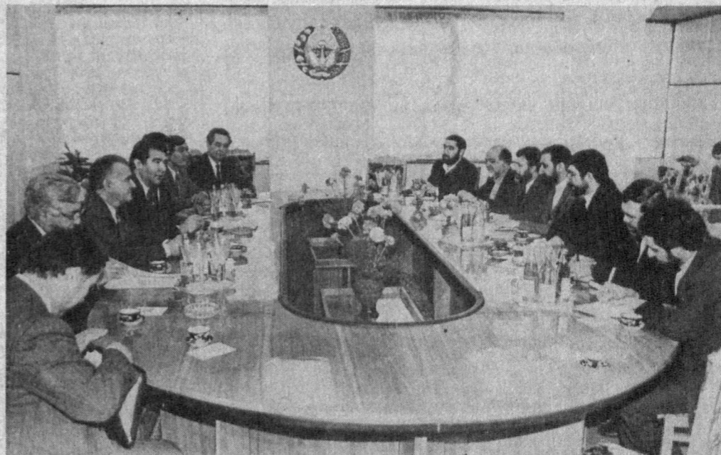
Республика Олий Кенгаши Раис қабулида.