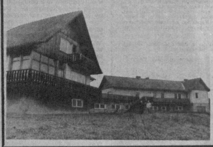
НА СНИМКАХ: майя М. Плисецкой в Травниском районе; М. Плисецкая на улице Вильнюса.

Мать известной советской балерины Майи Плисецкой родом из Вильнюса, а ее дед тоже проживает в Литве.