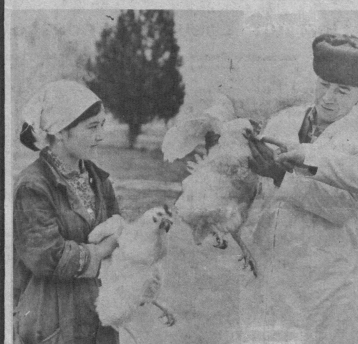
В прошлом году работники птицефермы совхоза имени Тиларьева Октябрьского района Джизакской области сдали государству 480 тонн мяса птицы, в т.ч. 1 миллион 200 тысяч яиц.