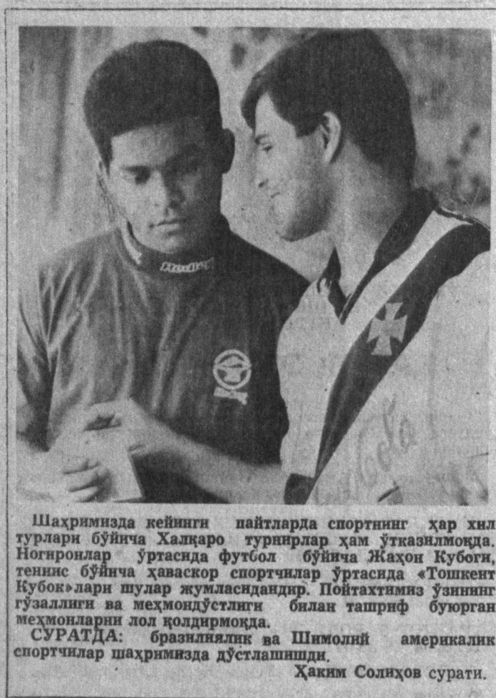
Шахримизда кейинги пайтларда спортнинг ҳар хил турлари бўйича Халқаро турнирлар ҳам ўтказилмоқда. Ногиронлар ўртасида футбол бўйича Жаҳон Кубоги, теннис бўйича ҳаваскор спортчилар ўртасида «Тошкент Кубоги» лари шулар жумласидандир. Пойтахтнинг ўзининг гузаллиги ва меҳмондўстлиги билан таширф бўлган меҳмонларни лод қодирмоқда.

... УШБУ қалами қўлга олдиран баҳорнинг янгилини, дархат бағрларининг қўқоқлашуви, курталарининг очилиши, ҳиссиётнинг чуқурлашуви ҳамда қўшлар сайрашининг ёрқинлашуви билан деб билдим. Тошкен қотиб, қордек музлаб, темирдек занг босиб қолган аёл қалбига илиқ қўёш нури кириб, аста-секин, авайлаб, асраб эрита бошлаганини ўша қалб ҳам ўзи ҳам билмай қолди, шенкили. Қайси учрашув, қай ҳолат, қайси қарашлару қай бир суҳбат орқали ўтди экан бу қалб меҳри? Бир нарсани сезамман. Бу меҳр ўзгача меҳр, чунки у нозикларнинг нозиги, бу меҳр ўзгача, чунки у икки-уч. Ун йилларнинг давомида учрамаган, яшириниб ётган меҳр, бу меҳр ўзгача, чунки у икки томондан қўшилиб юксак маънавий озуқа кўзасига ботирилган меҳр, бу меҳр ўзгача, чунки узоқ илтижолаб, жафолар, тўсиқларга учраб дарз кетган ҳиссиётга қайта жон киритган меҳрдир ва... Бу меҳрин инсонлар орасида «Инсон» бор эканлигини қидириб топиб, ўзига таъинган меҳр деб атадим. Шунинг учун ҳам унинг ҳарорати кучлироқ, алағаси ранглироқ, шамолди эса майинроқ, кўзга қўринмай гоёибона асирга олди қалбларини. Қалб кўрғонини эса темирдан эмас, гиштдан ҳам эмас, балки кўзга қўринмас 7 қаватли тағриқнинг девонидан кўрганга учуни, ташқарига қадам қўйиш осон бўлмас керак. Бу девон маънавий девон бўлгани учунми, ман-