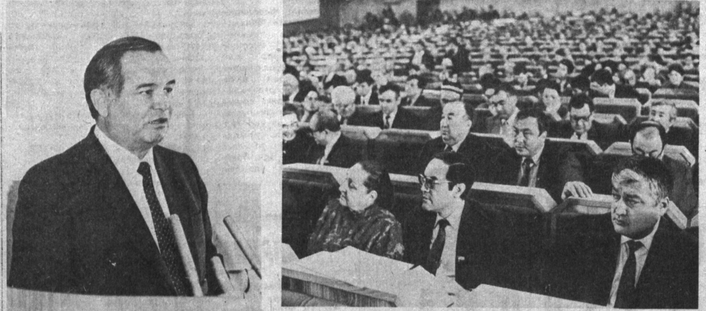
● Ўзбекистон Республикаси Олий Кенгашининг саккизинчи сессиясида.