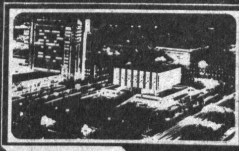
Рўзнома 1966 йил 1 июлдан чиқа бошлаган