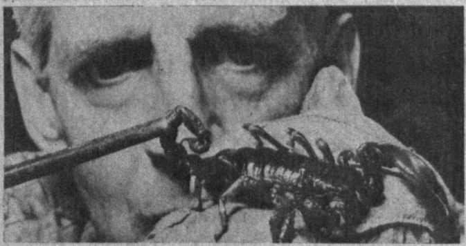
Ушбу юқоридаги суратда Шаркий Африкадан келтирилган 12 сантиметрли гаройб чаён Швейцарияда ўтказилган заҳарли ўргимчаклар кўргазмасига кўйилган экспонатларнинг бири, холос.

Малълум бўлишича ўзаро куч синашишда, фақат буқаларгина ягона эмас экан. Швейцарияда Альп ситирлари жанги энг сезимли томошалардан бири ҳисобланади.