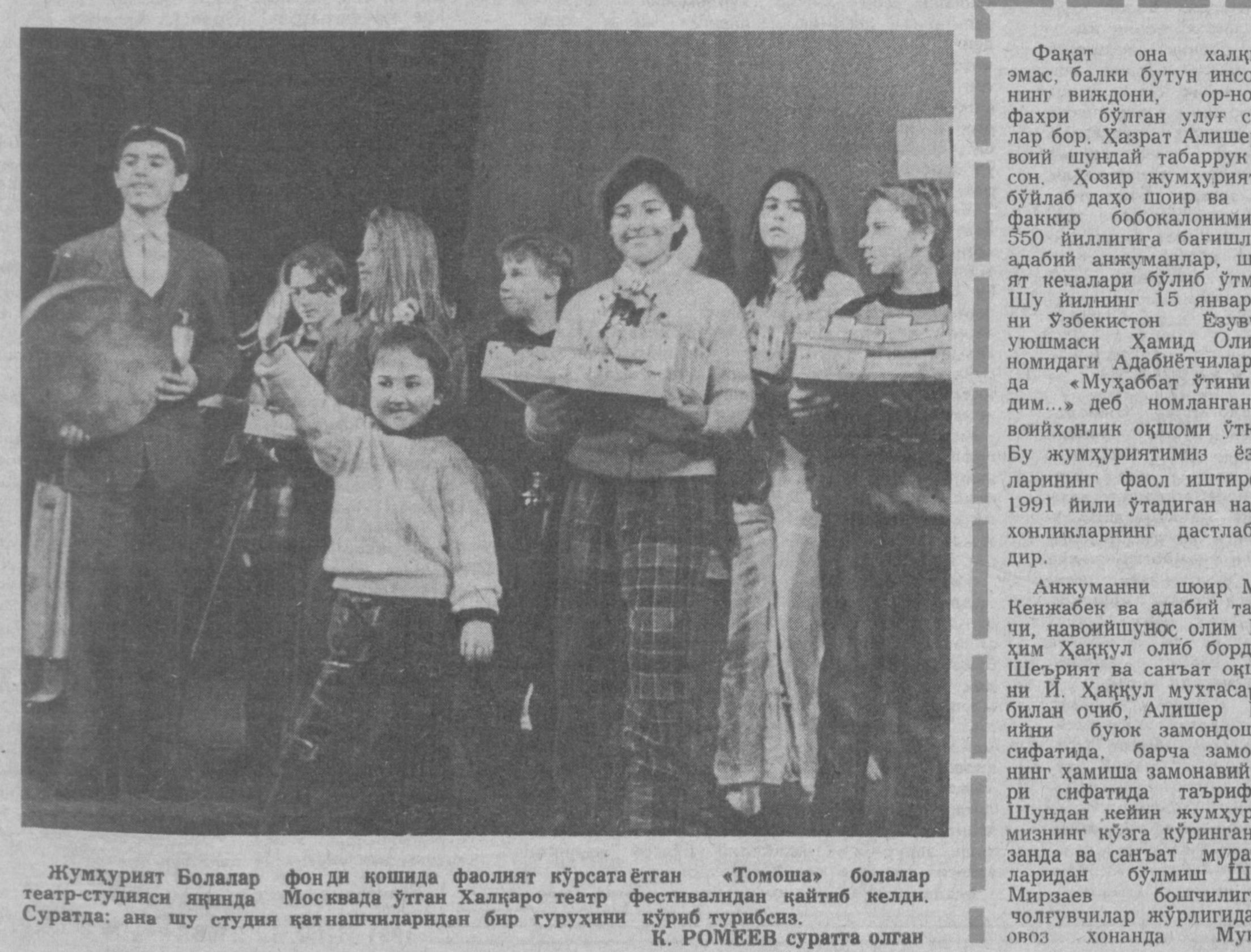
Жумҳурият Болалар фонди қошида фаолият кўрсатаётган «Тошош» болалар театр-студияси яқинда Москвада ўтган Халқаро театр фестивалидан қайтиб келди. Суратда: ана шу студия қатнашчилардан бир гуруҳини кўриб турибсиз.

лар жамияти ташкил топмагани, «Ўзбек тили жамғармаси» тузилмагани, бу борадаги тажрибалардан фойдаланилмаётганлиги эътироф этилди. Ингиллиз қатнашчилари атамашунослик ишини яхшилашга жамоатчилигини кенг жалб қилиш, тил равақи йўлидаги барча саъй-ҳаракатларни бирлаштириш лозимлигини айтишди.