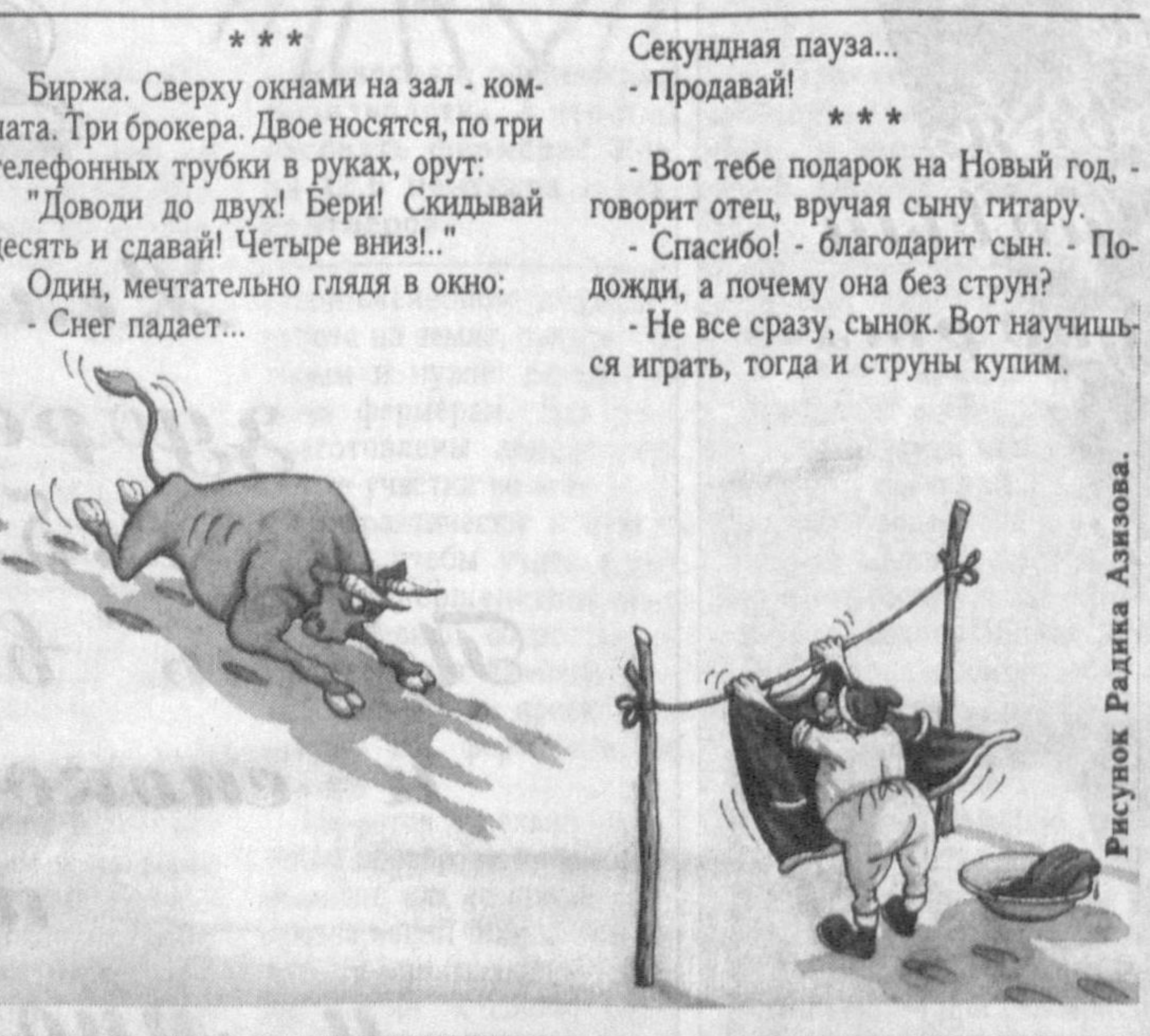
Рисунок Радика Азимова.

Что дает новогодняя елка людям? - Блаженное ощущение свободного пространства после того, как ее выкинули! ... Дорогой, - обращается жена к мужу, - а помнишь, как когда-то под Новый год ты провозжал меня домой, а моя собака сорвалась с цепи и покусала тебя?.. - Помню. Лучше бы она меня загрызла... Звонки в дверь. На пороге Дед Мороз. Маленький мальчик радостно кричит: - Здравствуй Дедушка Мороз! Ты подарки нам... - Не трывди, папан! Штопор есть! Клаустрофобия - боязнь Деда Мороза.