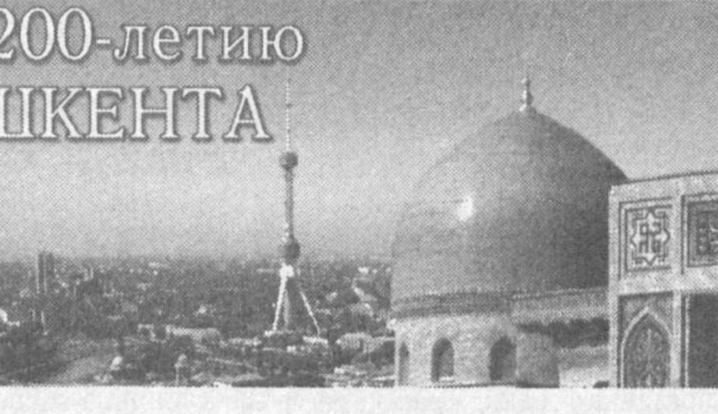
К 2200-летию ТАШКЕНТА

китайском сосуде закрытой формы с желтой глазурью, датированном 575 годом. В китайских источниках упоминается и танец девушек из Чача в ярких халатах с серебряными поясами и выражается восхищение певицей из Чача. В эпоху кушан, эфталитов и Тюркского каганата Ташкент играл немаловажную роль в установлении двусторонних музыкальных связей между Согдом и Восточным Туркестаном, Бактрией и Северной Индией. Ярким свидетельством торговых отношений, развитию которых способствовал Ташкент, являются монеты. На городище Канка - столице Кангюя в III веке н.э. - найдены и ханьская медная монета у-шу, более 300 монет древнегреческих и монеты древнеиранского чекана. Ташкент был одним из основных пунктов "урбанистического взрыва" в регионе в средние века, когда усилилась северная ветвь Великого шелкового пути. Арабские географы IX-X веков Кудам и Ибн Хордадбек сообщают, что из Мерва на Восток вели две дороги: одна - к области Шаша и городам тюрков, другая - области Тохаристана. Шаш был важным отправным и перевалочным пунктом в северной части Великого шелкового пути. В VI - VIII веках количество городов и поселений здесь выросло в 2,5 раза. Средневековые арабские и персидские источники описывают обилие городов и развитую экономику Чача. Географ X века Истахри писал: "В Шаше и Илаке много городов с воротами, стенами, рабадами, цитаделями, рынками и каналами, протекающими через города". Ибн Хаукаль утверждал, что "в Маверауннахре нет стра-