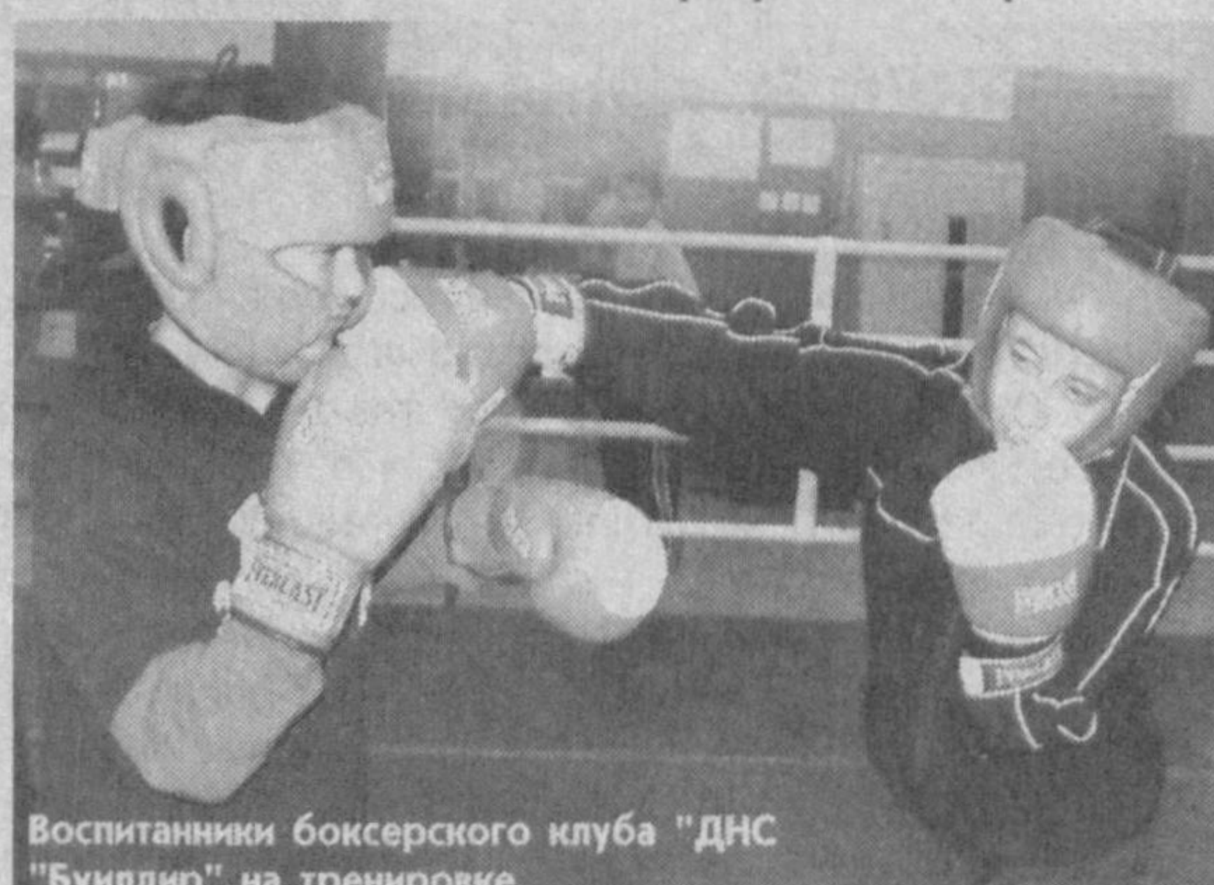
Воспитанники боксерского клуба "ДНС "Бундир" на тренировке.