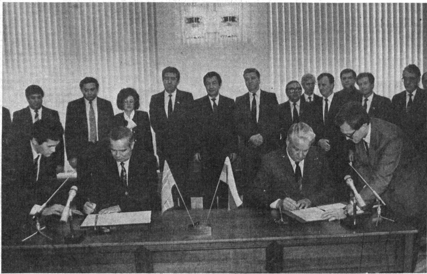
СУРАТДА: Ўзбекистон Республикаси Президенти И. А. Каримов ҳамда РСФСР Президенти Б. Н. Ельцин шартномага имзо чекишмоқда.