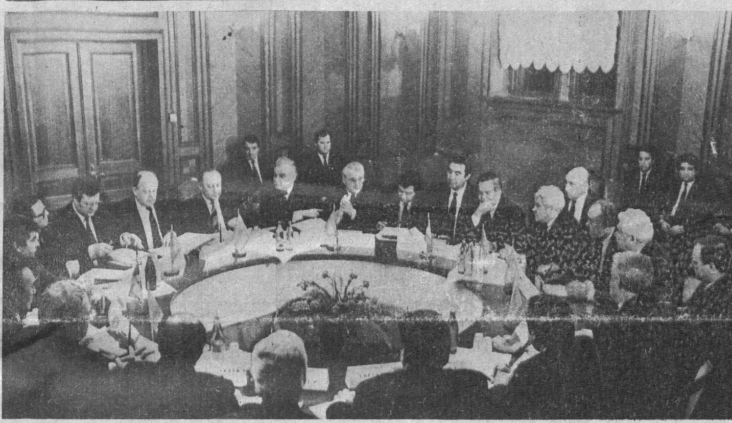
На совещании глав государств в Минске. Делегацию Республики Узбекистан возглавлял Президент И. А. Каримов. НА СНИМКЕ: во время встречи.