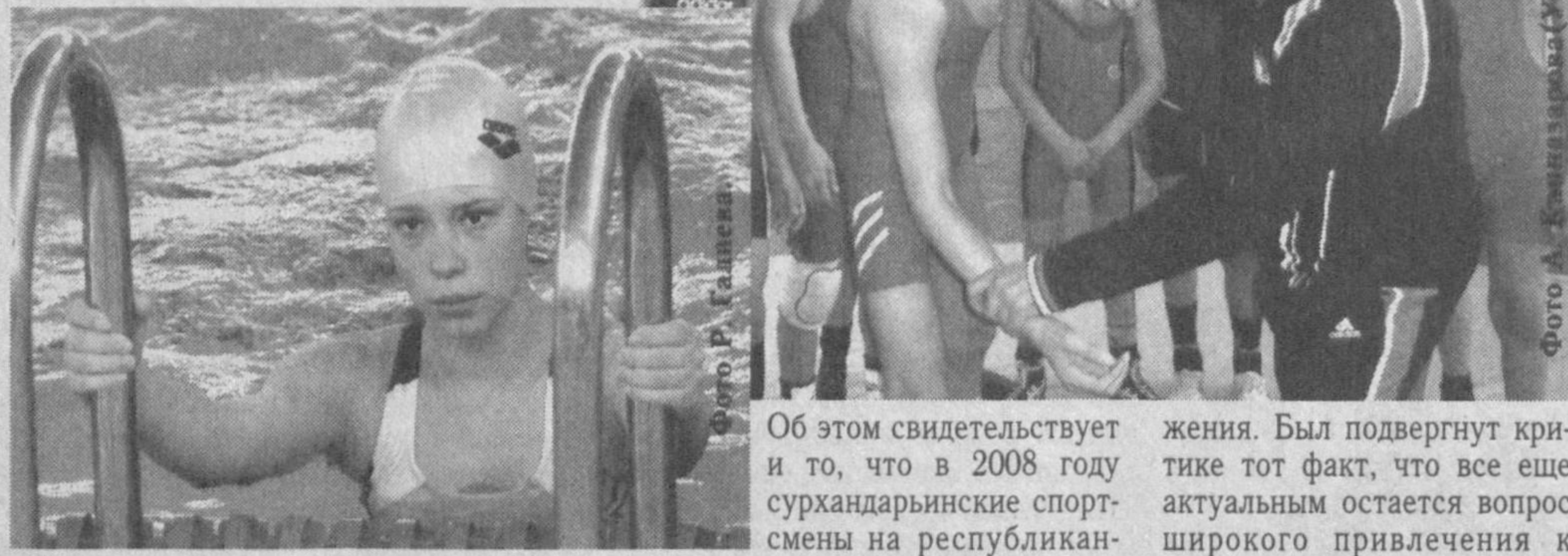
Об этом свидетельствует и то, что в 2008 году сурхандарьинские спортсмены на республиканских и международных состязаниях удостоены 125 медалей.

В области усиливается внимание к вопросам оздоровления всех слоев населения, дальнейшей популяризации спорта среди молодежи, женщин, выявления и поддержки одаренных спортсменов, организации различных спортивных соревнований. В более чем шестидесяти спортивных состязаниях, проведенных 2008 году областным филиалом Фонда развития детского спорта, приняли участие около 13 тысяч мальчиков и девочек. Около десяти тысяч из них составили сельская молодежь.