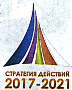
СТРАТЕГИЯ ДЕЙСТВИЙ 2017-2021

Другая новость - из Навои. По предложению местного горно-металлургического комбината и других учреждений в этом городе создается отделение АН, второе после Каракалпакского. НГМК обеспечит его финансовую поддержку, а председателем структуры станет заместитель генерального директора предприятия по науке. Оно будет анализировать состояние промышленности и сельского хозяйства области, определять проблемы и направления для поиска их эффективного решения. Среди направлений - геология, горное дело, металлургия, экология, химическая технология, машиностроение, сельское хозяйство и другие.