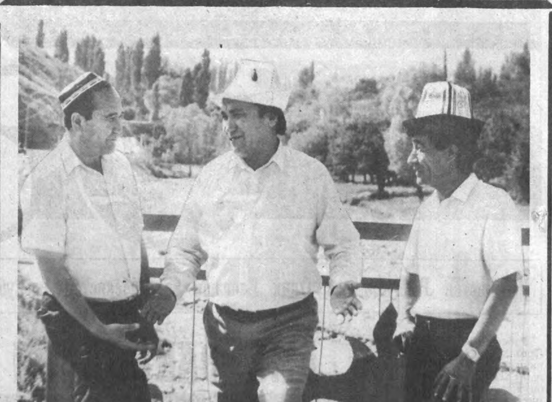
Баян: «Чегарани ким ўйлаб топди экан», деб ўйлаб қолсан, киши. Зотан, қанбалар тутаган жойда, у шунчаки восита бўлиб қолганини биз билмасакда, аждодларимиз яхши англашган.

Ю. РЯЖЕНЦЕВ, Тошкент — Истамбул — Тошкент.