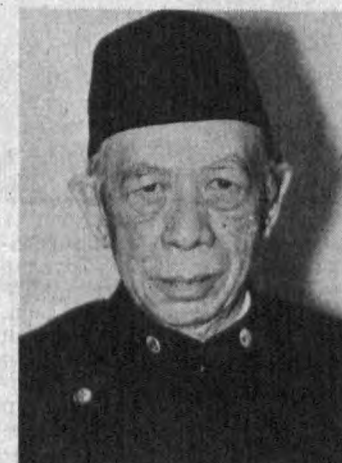
тайинланган (Япония). 1960—1964 йиллар —

1929 йил 1 январда Индонезиянинг Габрий Явасиди Вандум шаҳрида туғилган. 1945—1949 йилларда — Мустақиллик учун бўлган урушда Силиван дивизионда хизмат қилган, Габрий ва марказий Явада жангларда қатнашган ва Силиван дивизионис юришига қўшилган. 1950—1954 йиллар — «Миллат» хоржий хизмат академиясининг иккунимий ва сиёсий фанлар факультетига ўқишга кирган. 1954—1956 йиллар — Ташқи ишлар департаментини таъин қилинган. 1956—1960 йиллар — Токиода вице-консул этиб тайинланган (Япония). 1960—1964 йиллар —