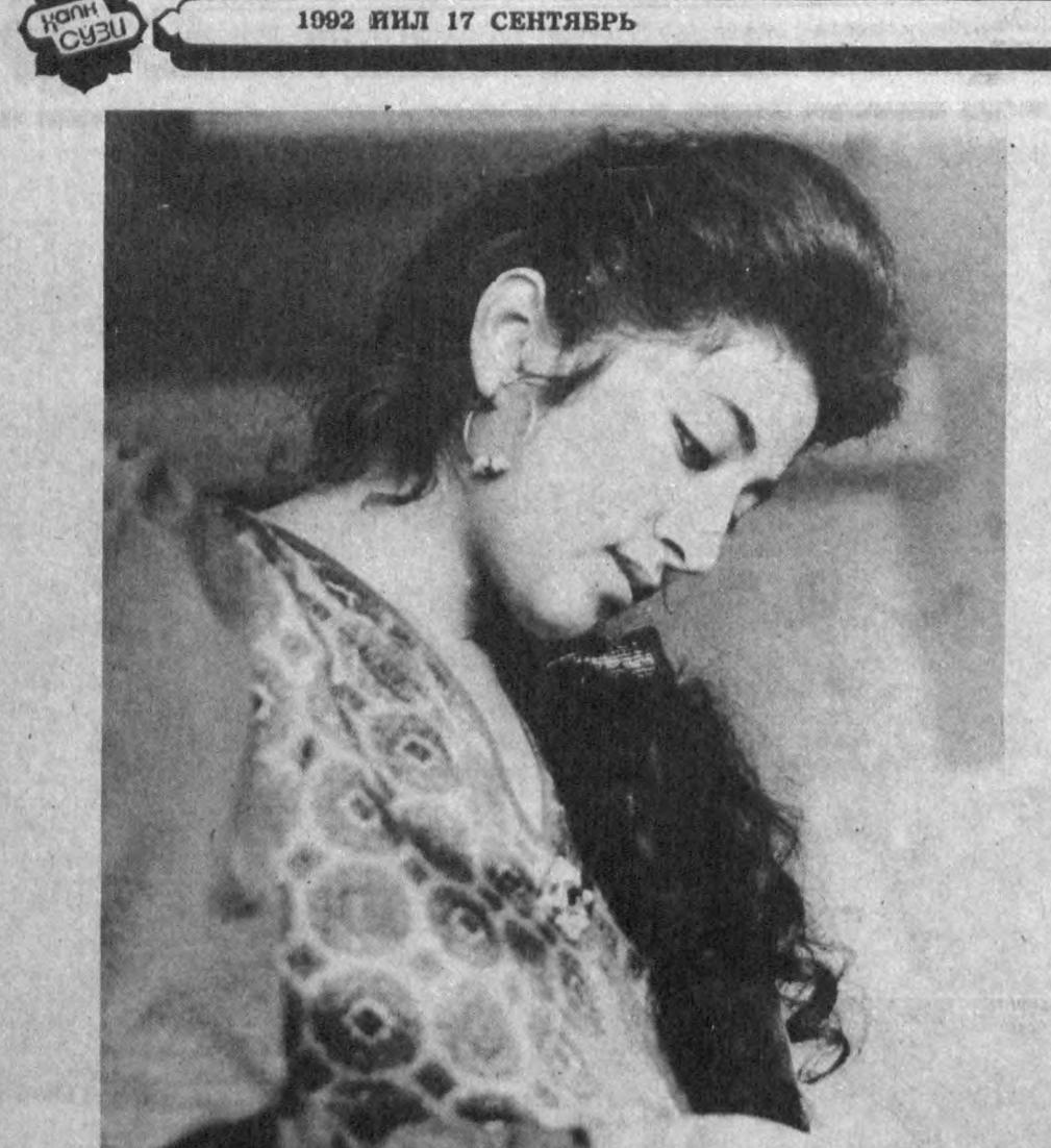
ХАЛАЛ БЕРМАНГ АГАР ҚИЗЛАР ХАЕЛ СУРСАЛАР...