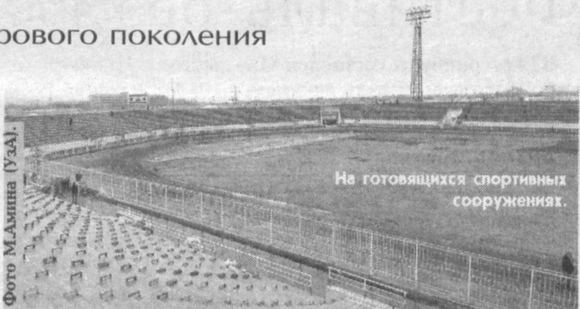
На готовящихся спортивных сооружениях.

Правительством приняты специальные меры для подготовки физкультурно-педагогических кадров-женщин. Например, за последние два года на факультет физического воспитания Гулистанского государственного университета принято вдвое больше девушек. Вот уже третий год в нашем университете проводятся спортивные и тестовые испытания, по результатам которых на новое направление "Физическое воспитание женщин" в Узбекский государственный институт физической культуры зачисляются женщины из Сырдарьинской области.