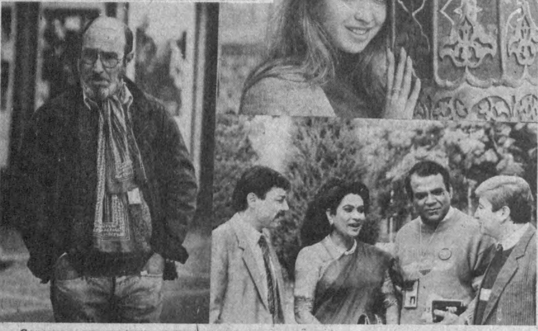
Суратда: киноанжуман қатнашчилари.