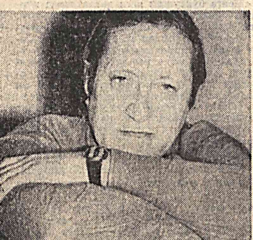
рус тилига таржима қилган. Қуйида шoirнинг янги шеърларини эътиборингизга ҳавола этамиз.