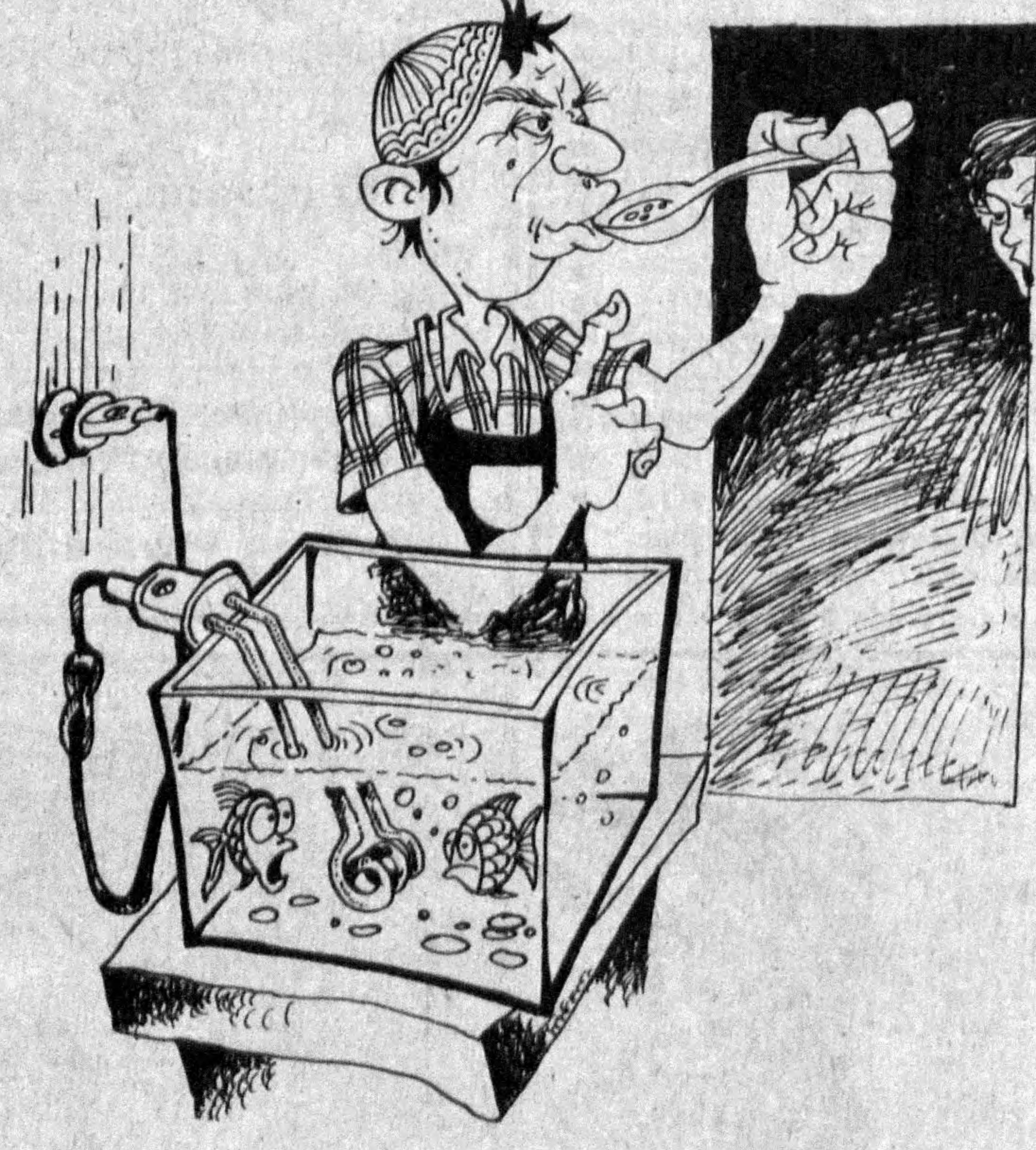
Яна беш минутдан кейин балиқ шўрва тайёр бўлади, хоним. Суръат САЛОҲИДДИНОВ чизган расм.

— Азиям, сизга терилган гўшти кўрсам васлингиз умидда дардга чалинган жигарим эсга тушади. Қўрадаги олов уни пиширган сари «биров нақд пулга илби кетади», деб хавотирланаман.