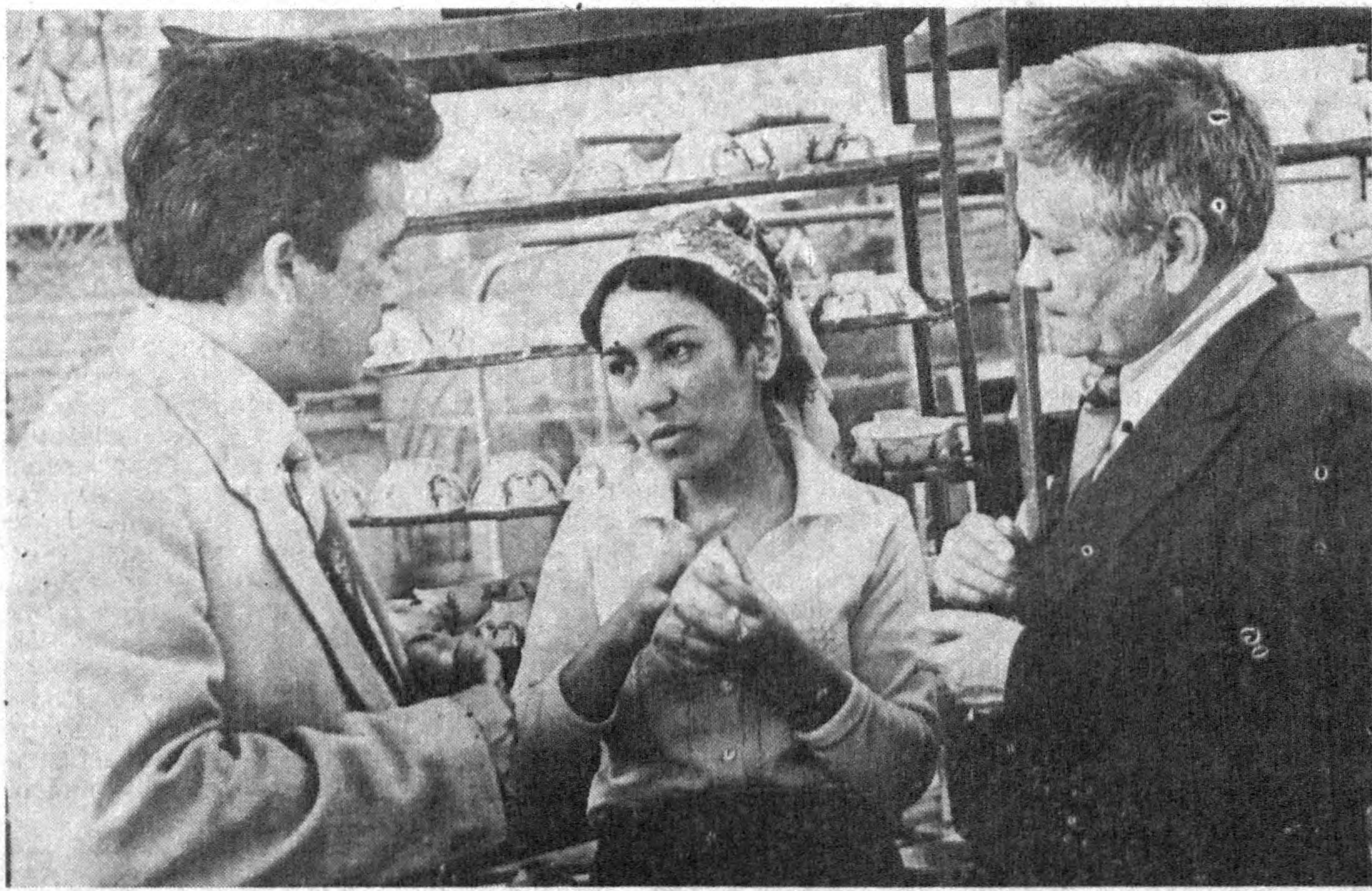
Туроб Тўла ҳамisha эл орасида бўлади...