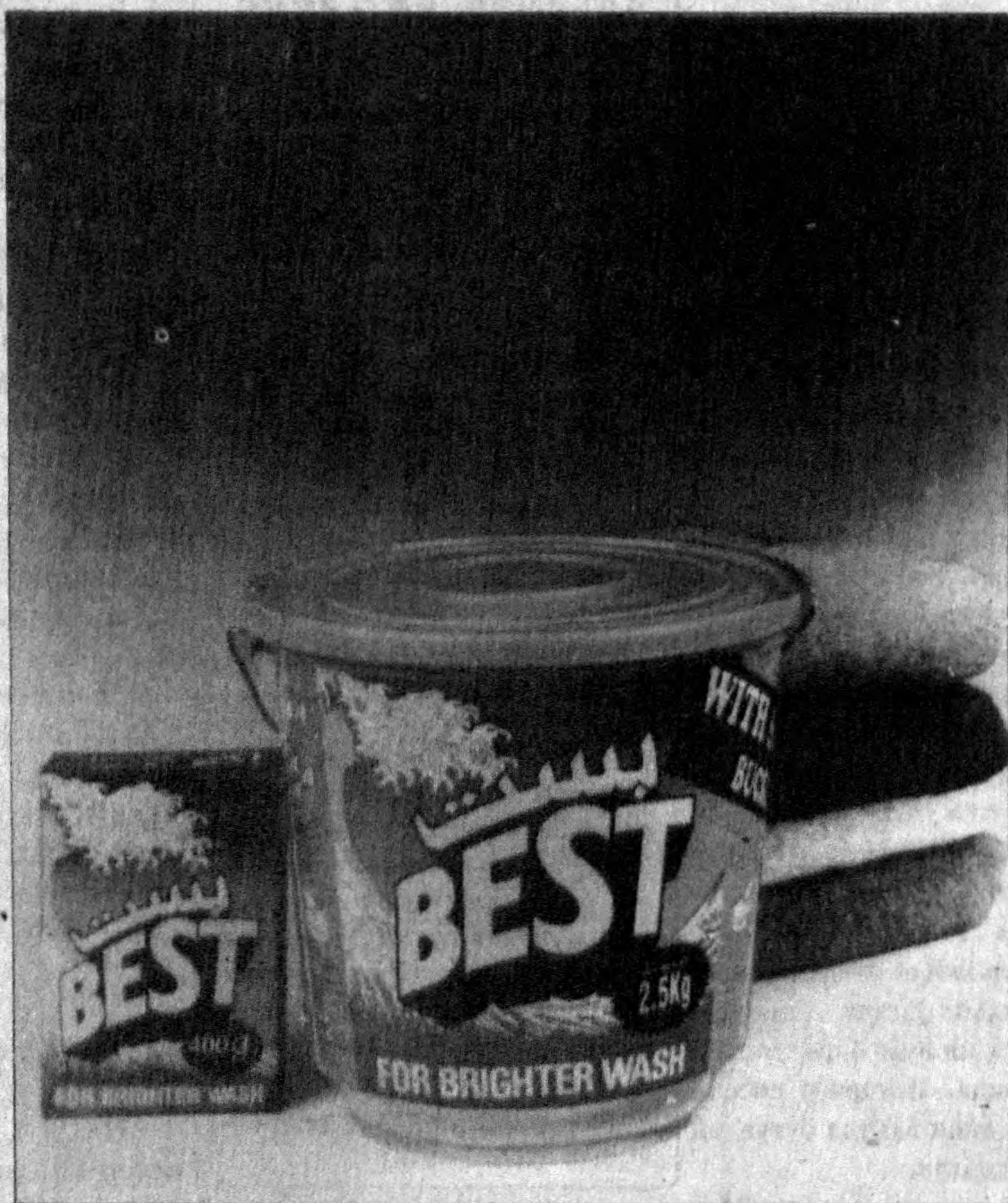
БЭСТ: Моющее средство с отбеливателем - для более чистой и нежной стирки белья

У нас вы найдете все самое лучшее в мире