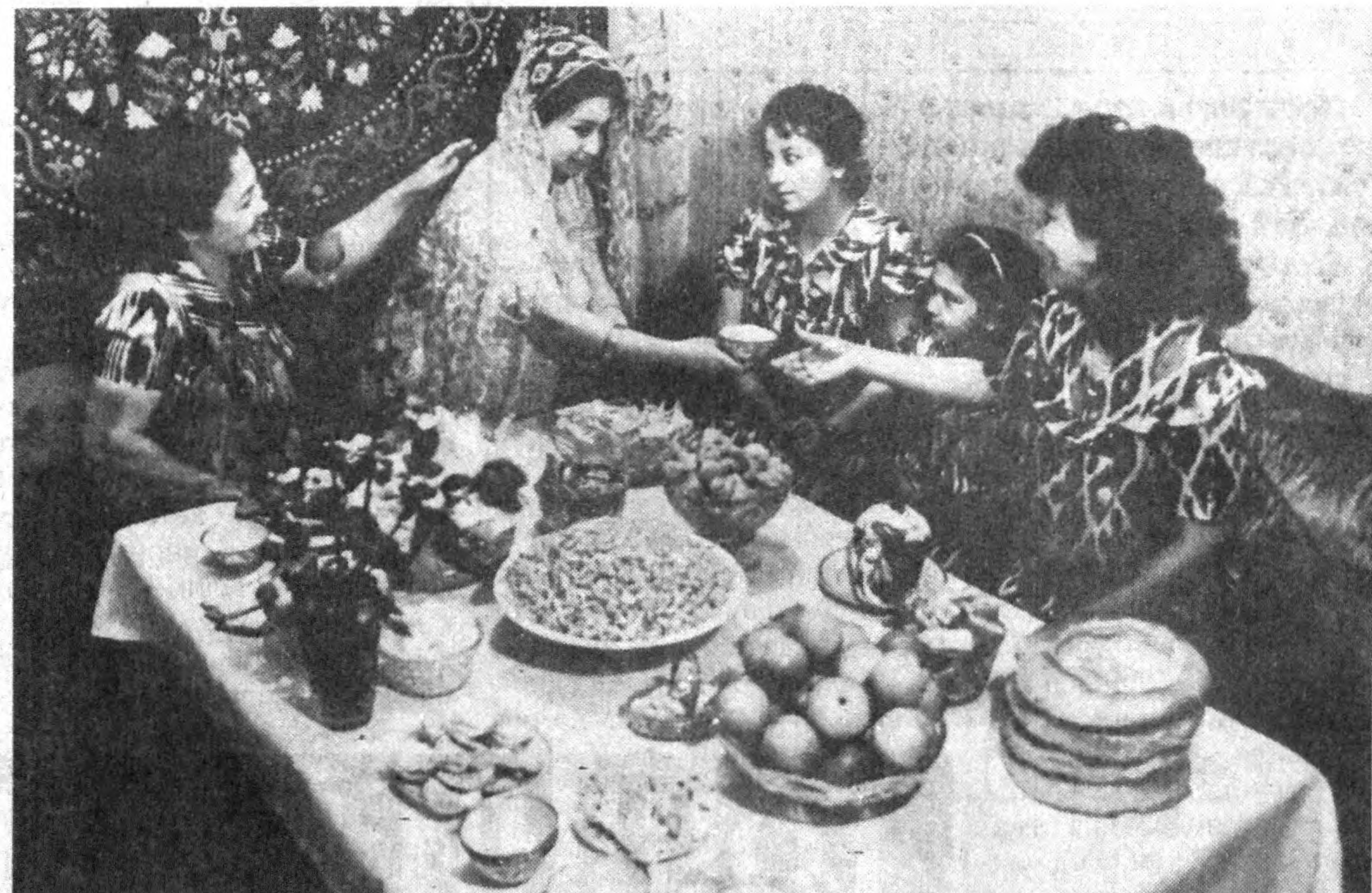
Сўзана ва папакларнинг гулшанида, атлас ва шойиларнинг ўтли даврасида дугоналарнинг дилбар келин қўлидан пилда олишида қанчалар нафосат, қанчалар ёруғлик бор.