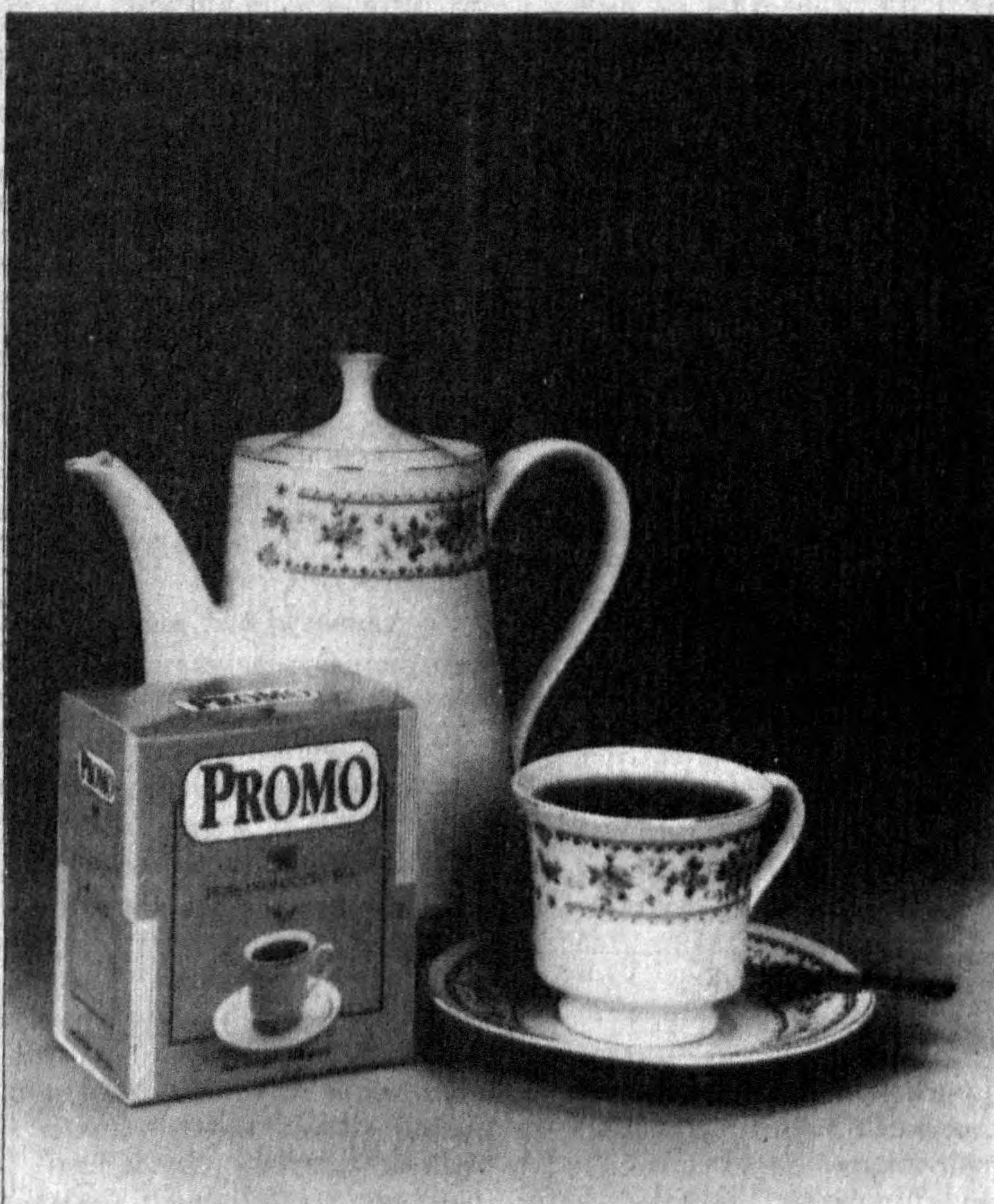
ПРОМО: Чистый индийский CTC чай. Изготовлен из специально отобранных сортов чая для полного удовлетворения ваших вкусов.