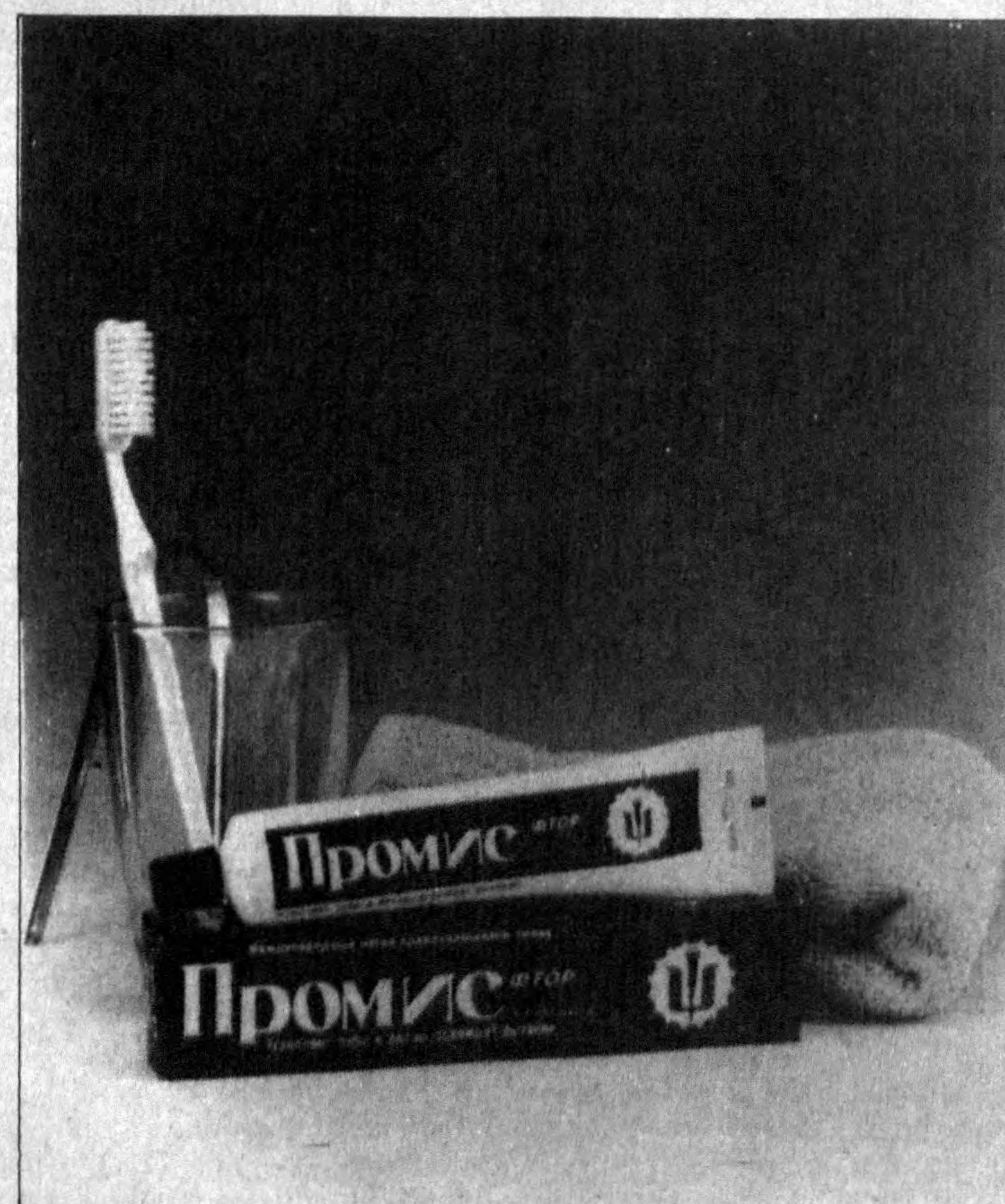
ПРОМИС: Уникальная зубная паста с содержанием фтора. Отбеливает и придает блеск вашим зубам. Приятный запах в ротовой полости в течение целого дня.

ПОСЕТИТЕ НАС, И МЫ ПРЕДСТАВИМ ВАМ ОСОБОЕ ПРЕДЛОЖЕНИЕ !