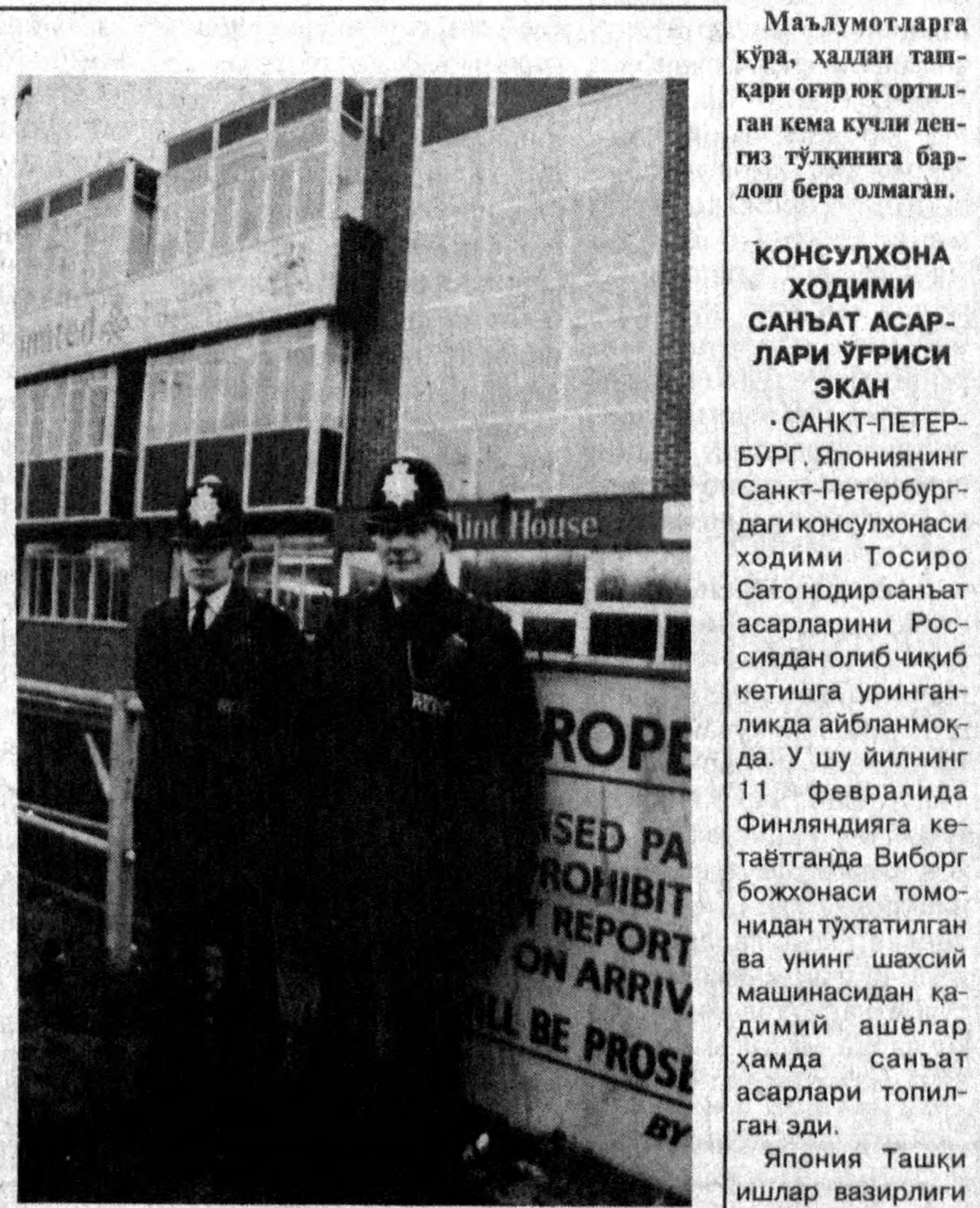
СУРАТДА: Англия полицияси.

Япония Ташқи ишлар вазирлиги ушбу воқеа билан боғлиқ барча ахборотларни атрафчилик урганатир. Тосиро Сато эса айни пайтда Санкт-Петербургда сақланмоқда.