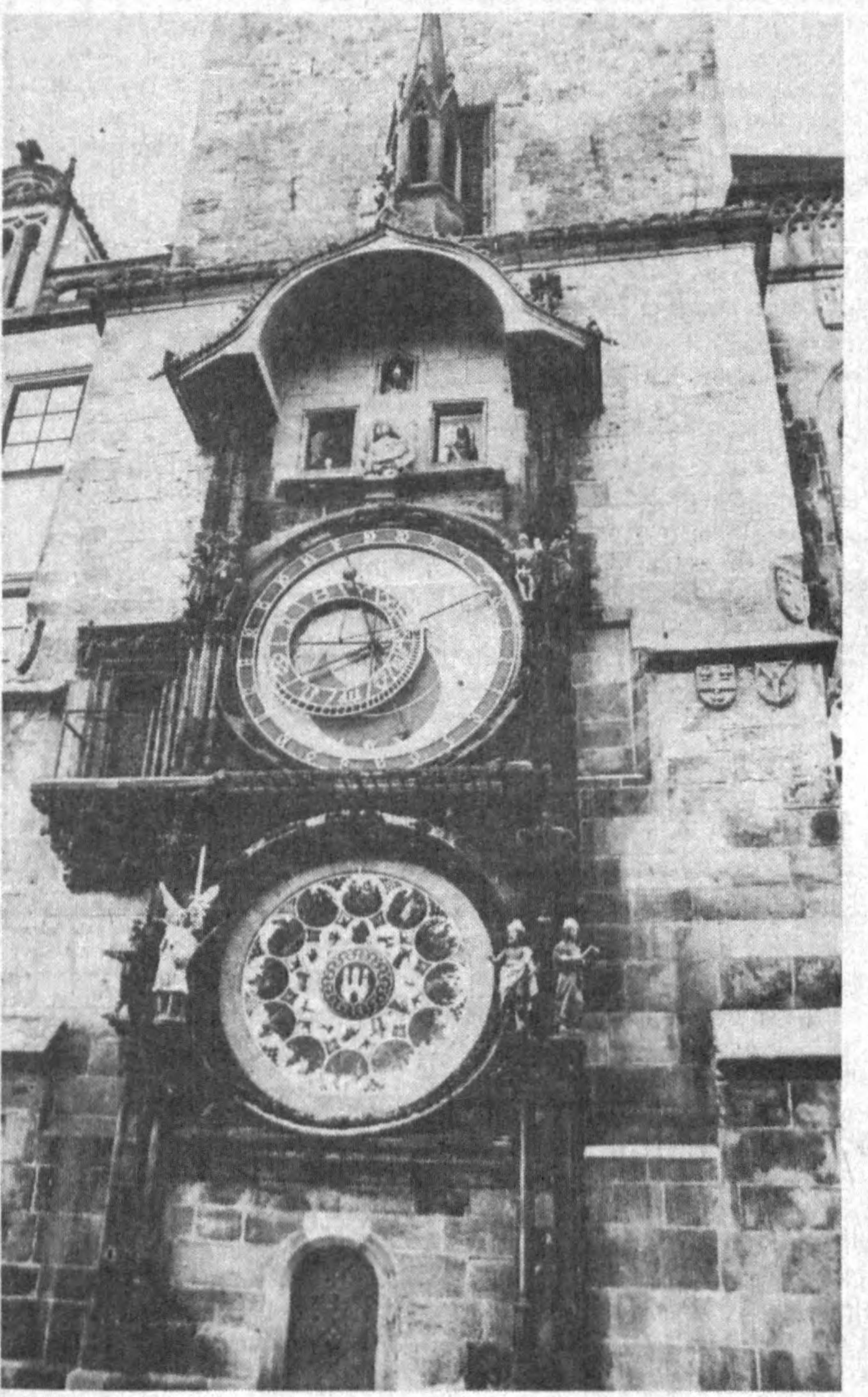
Чехия бинокорлиги. УЗА олган сурат.

АҚШ Президенти Билл Клинтон ва Россия Федерацияси Президентини Борис Ельцин таҳминан март-апрель ойларида учрашиши мумкин, деб маълум қилди АҚШ давлат департаменти вакили Николай Бернс. Унинг таъкидлашича, мазкур учрашув жойини Москвага қўчириш режаси ҳақида аниқ маълумот йўқ.