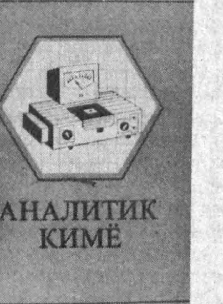
Уйлаймизки, қўлланма мамлакатимизнинг эртанги тарққиети йўлида кимё сир-асрорларини ўрганаётган барча юртдошларимизға асқотайди. Хумоюн АБДУШУКРОВ.

тайерланган Олий уқув юрлари талабалари учун яратилган «Аналитик кимё» уқув қўлланмаси. Китобни илк бор қўлга олган толиб унинг жуда юқори савияда ёзилганини бирдан англаб етди. Бойси, аввалги қўлланмалардан фарқли ҳолатда бунда муаммоли масалалар кенг ва батафсил ёритилган. Талабаларнинг мазкур фан сирларини тез ўзлаштириб олишлари учун лозим бўлган барча талаблар юқори даражада амалға оширилган. Қўлланмада аналитик кимёнинг вазифалари, қўлланадиган оптик, электро-