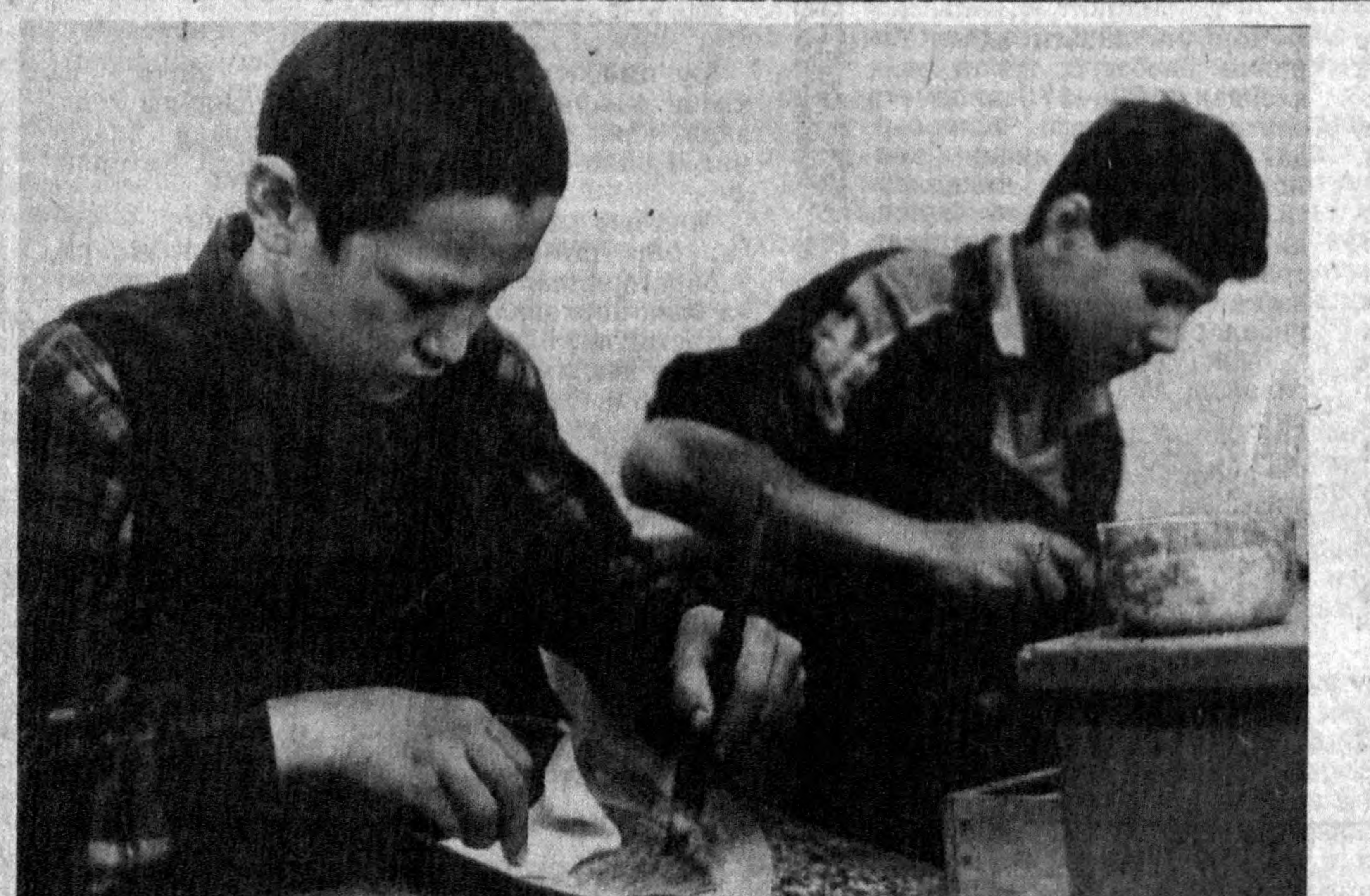
Қўн шаҳридаги Алишер Навоий номидаги маҳалла ҳудудда «Маҳалла маҳали» қад кўтарди. Бу ерда пойабзал тикиш ва таъмирлаш, тикуччилик, тукувчилик, кийимларни тозалаш, радио ва телеапаратура устaxonалари ҳамда сартарошхона ишга туширилди...

ҚИСКАРТИРИШ — МАЖБУРИЙ ЧОРА. (Жаҳон ахборот агентликлари ва рўнома ларида олинди)