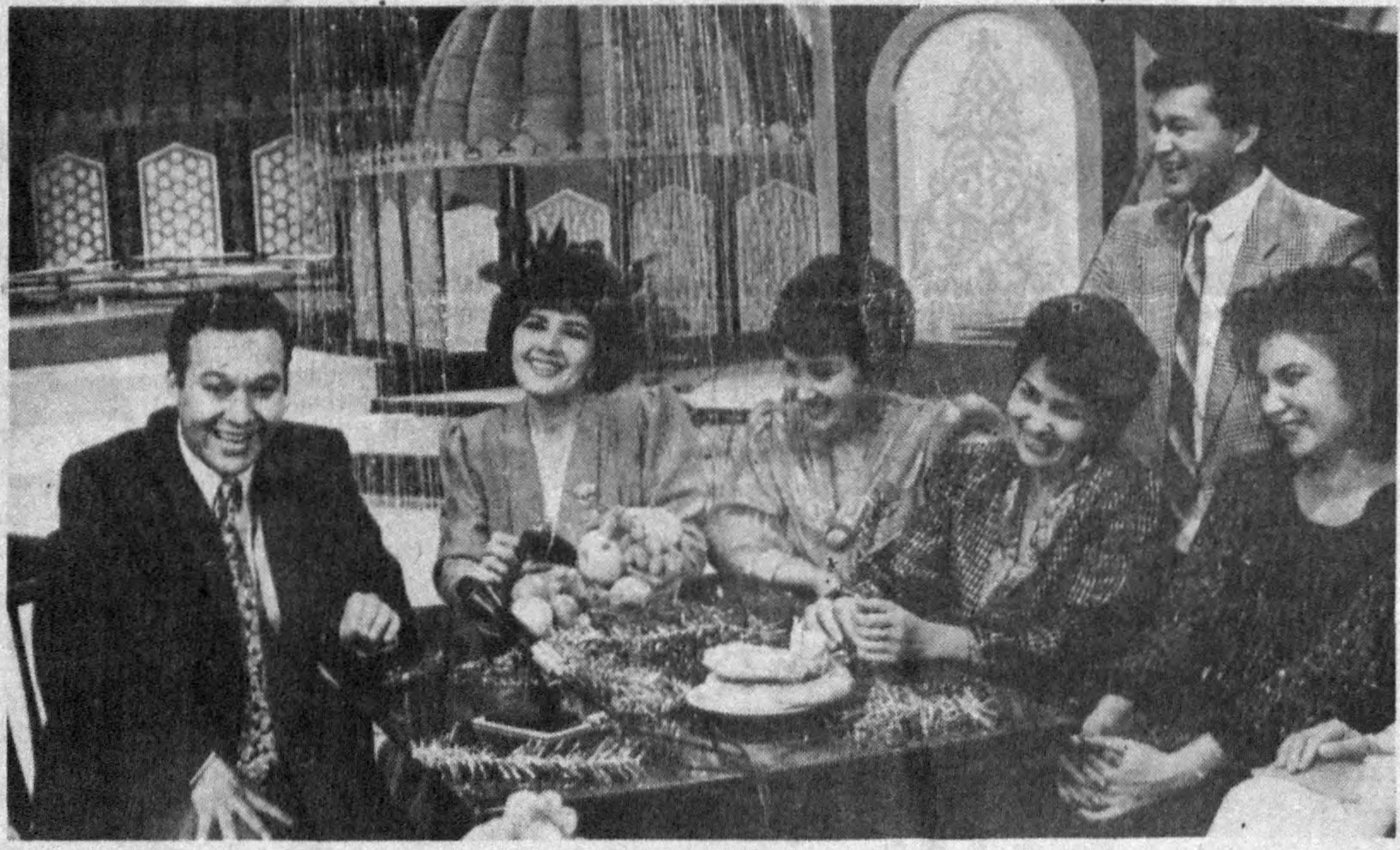
Ўзбекистон «ойна-жаҳони»да Янги йил кўрсатувлари 29 декабрдан бошланди. Шу кунги «Тақдир ҳазили ёқи қўшқед енгил бўлинг» бадиий фильмининг кўрдиш. 30 - 31 декабрь кунлари ҳам гоятда ранг-баранг теле-кўрсатувлар томошбиларга ҳавола этилди. «Барча табрик